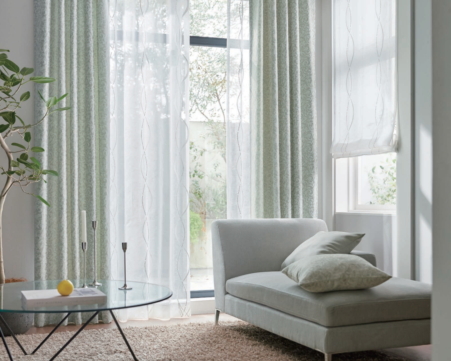
左:U-5041 (フラット) ドレープ:U-5085 右:U-5041 プレーンシェード:R07H クッション:C1A・U-5085・U-5155 ラグ:BIGフレールシャギー FR-2 ベージュ