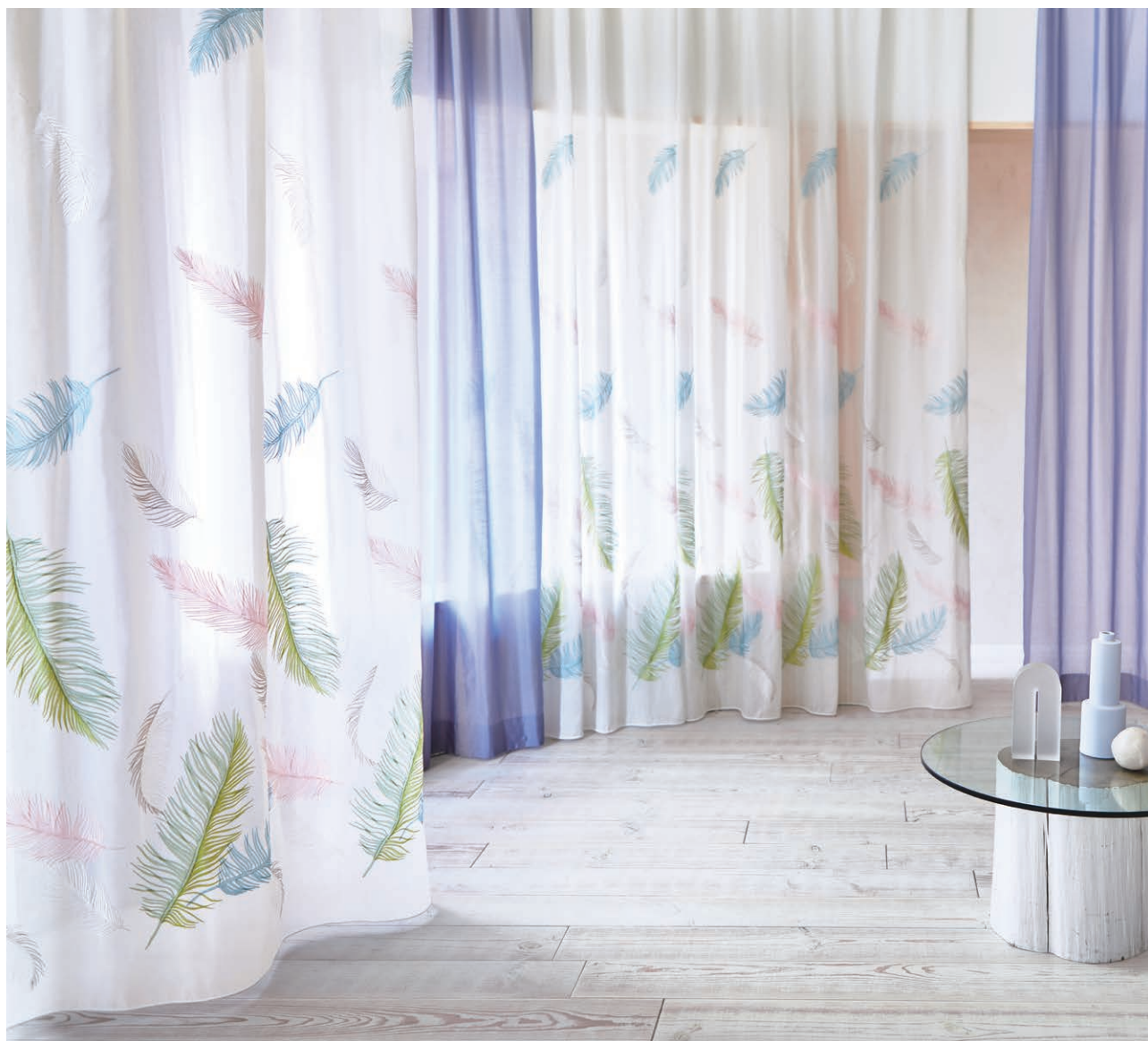
U-5010 (フラット) シアー:U-5389 (フラット)