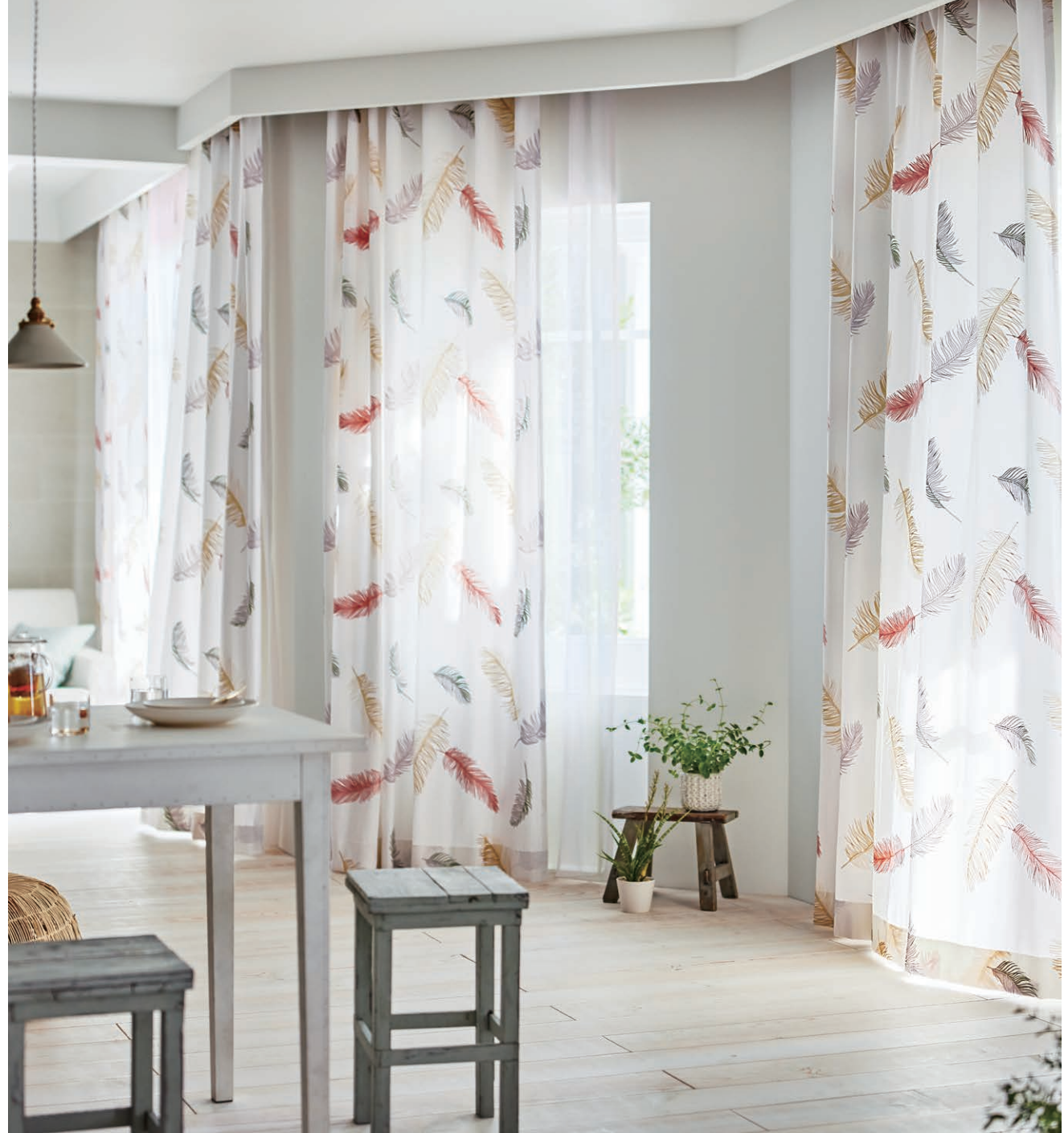
U-5008 (フラット) シアード:U-5399 (フラット)