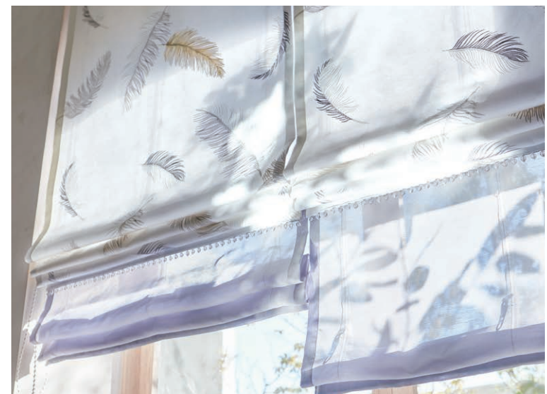
U-5007 プレーンシェード ダブルタイプ・アラカルトトリム付・R07S&R07H-U-5007 (フロントトリム:T-5424) + U-5387 (バック)

生地の左右に無地部分がある、ヨコ150cm リピートのデザインです。デザイン上、 巾継ぎ部分は無地になります。