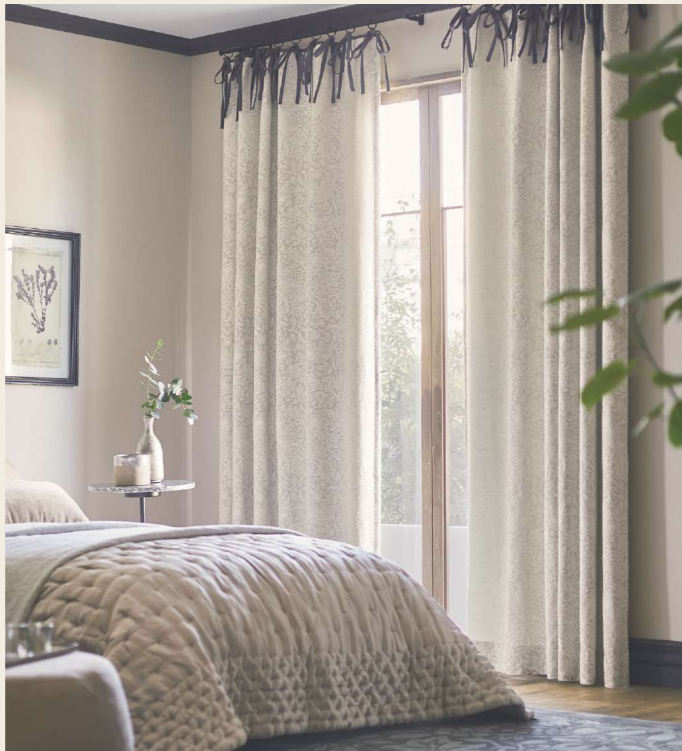
トップリボンカーテン：SC7460・MCF292(23 MORRIS CHRONICLES) クッション：MCF301、MCF305(23 MORRIS CHRONICLES) 壁紙：MCW246(23 MORRIS CHRONICLES) ラグ、フロアタイル：MCG345S、MCT370(23 MORRIS CHRONICLES)