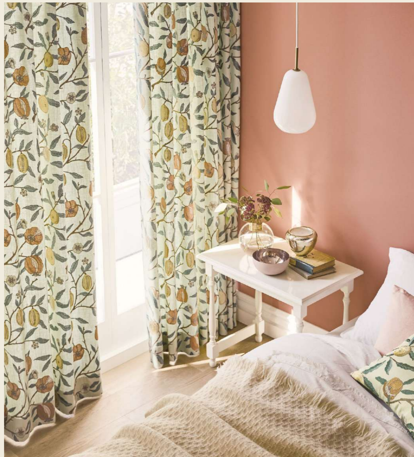
ドレープ：SC7445 クッション：SC7445、MCF290(23 MORRIS CHRONICLES) 壁紙：MCW254(23 MORRIS CHRONICLES) フロアタイル：MCT377(23 MORRIS CHRONICLES)