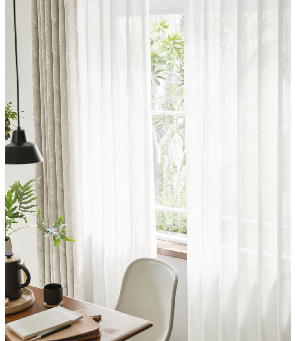
レース：SC8706 カーテン(形態安定加工)：SC8252(P.136)