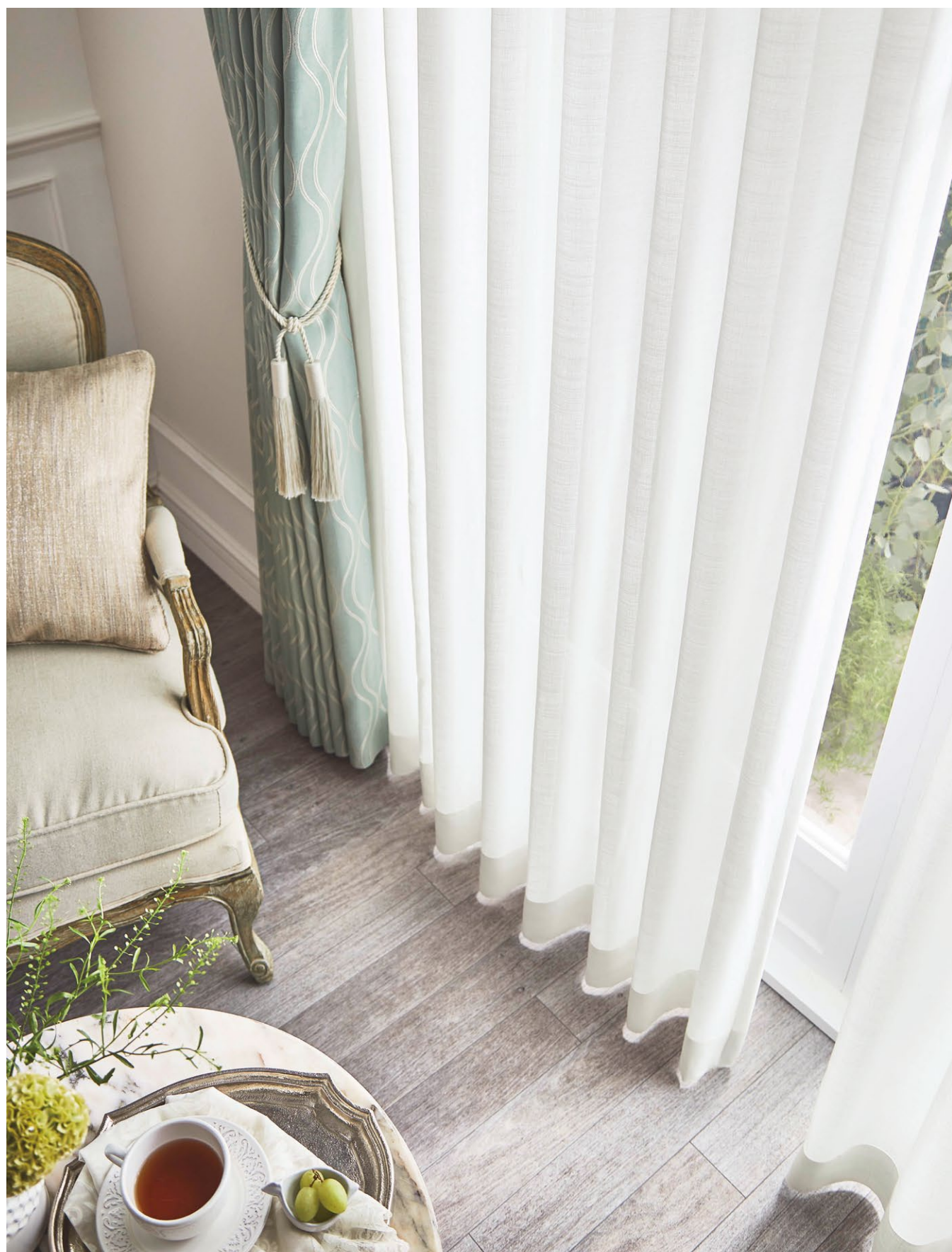
シアーカーテン: SC8682 カーテン(形態安定加工): SC8134(P.74) タッセル: FN607 クッション: SC8307(P.164)