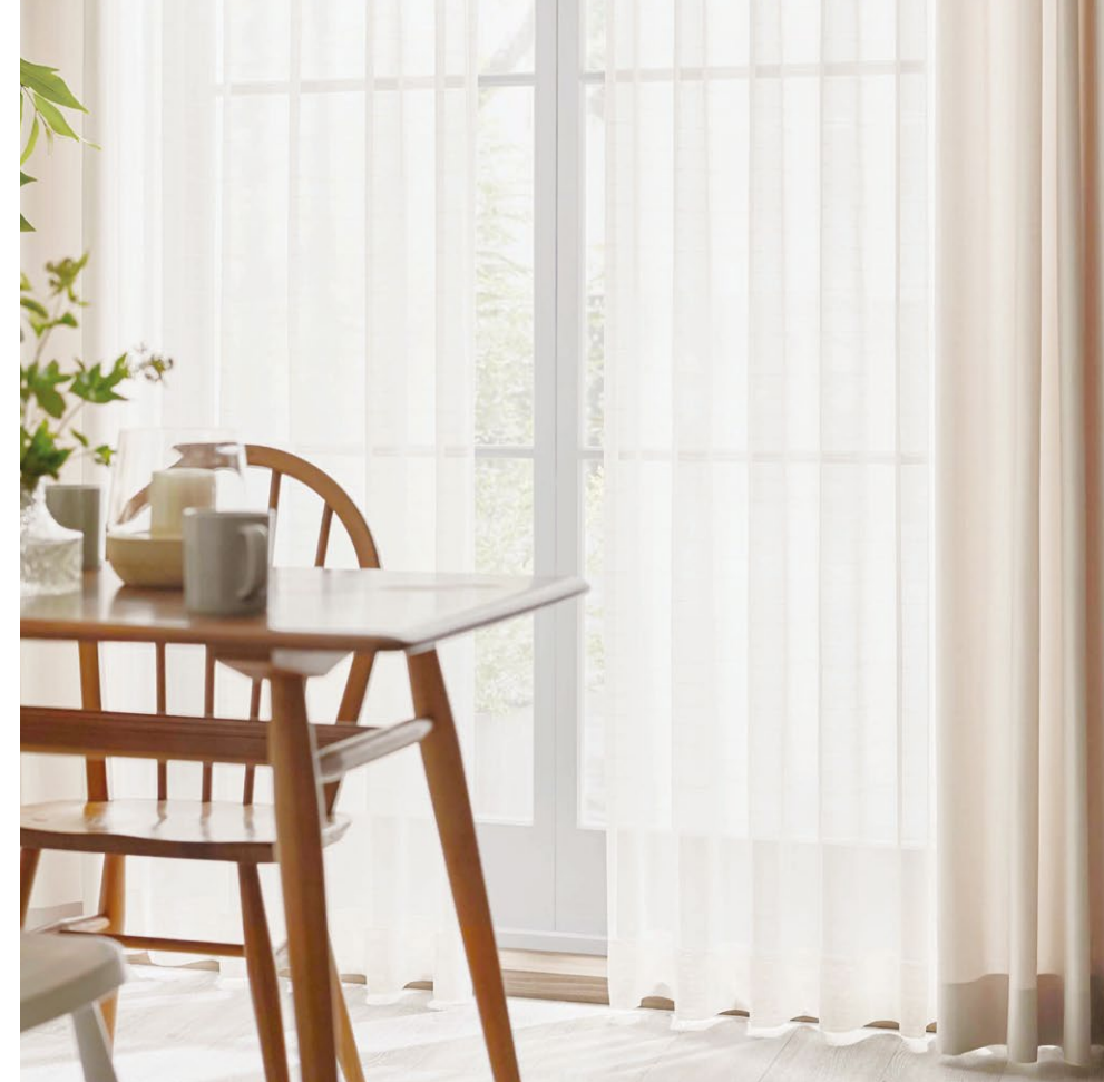
シアーカーテン : SC8662 カーテン(形態安定加工) : SC8234(P.123)