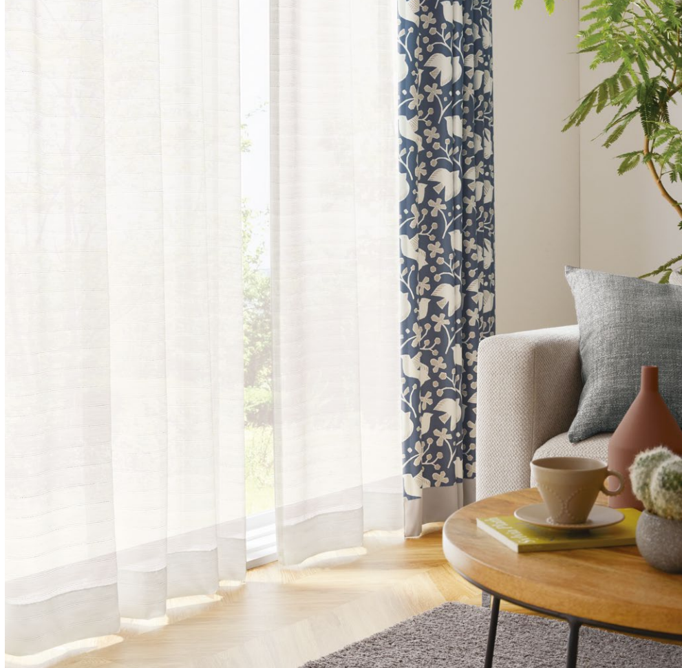
フラットシアーカーテン(1.5倍) : SC8661 クッション : SC8309(P.164) ボーダー付フラットカーテン(トップ&ボトム型、1.5倍) : SC8448(P.195)・SC8541(P.220、別冊Beside P.33)