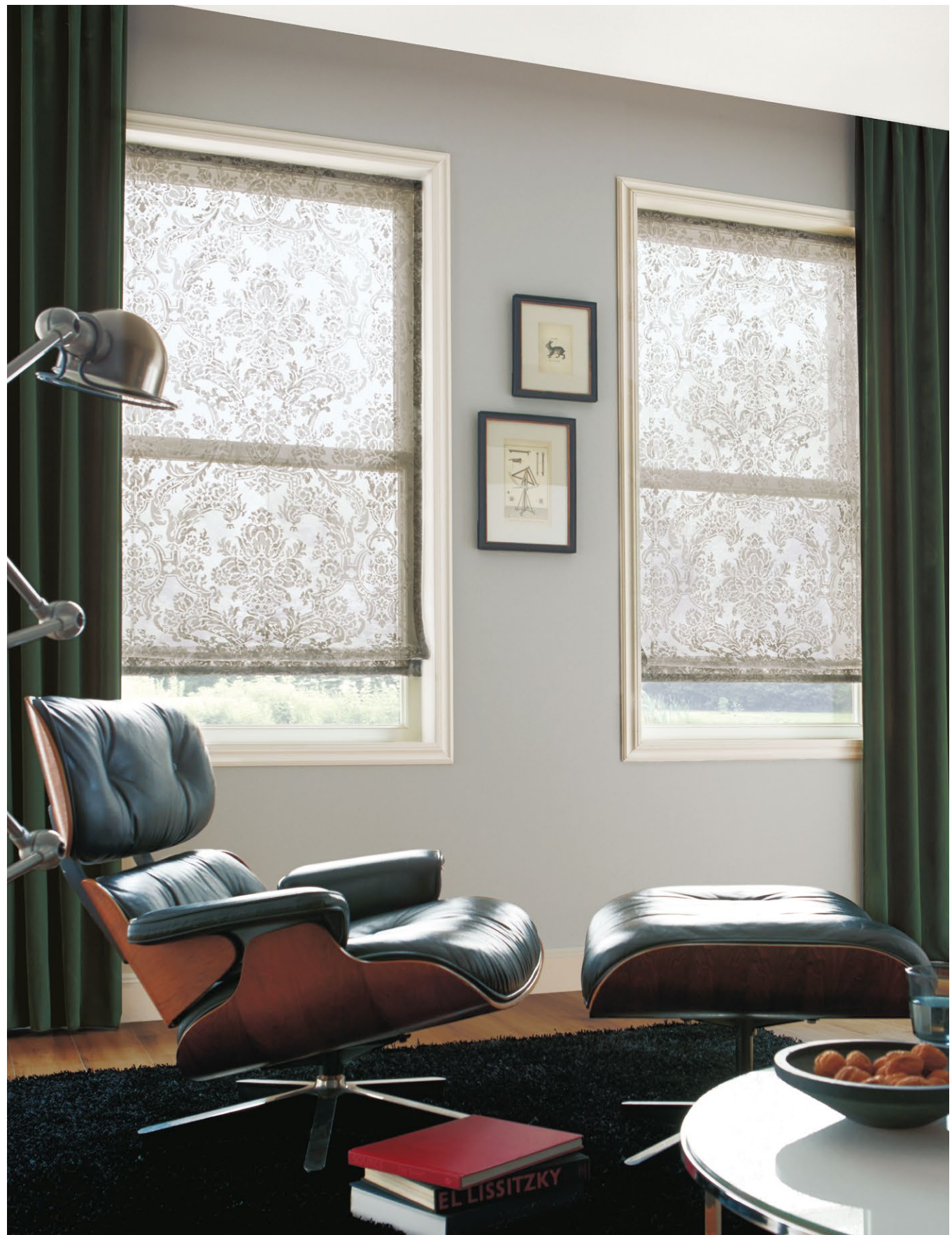
プレーンシェード: SC8604 カーテン: SC8411 (P.178) 壁紙: FE74620(2021-2023 FINE)