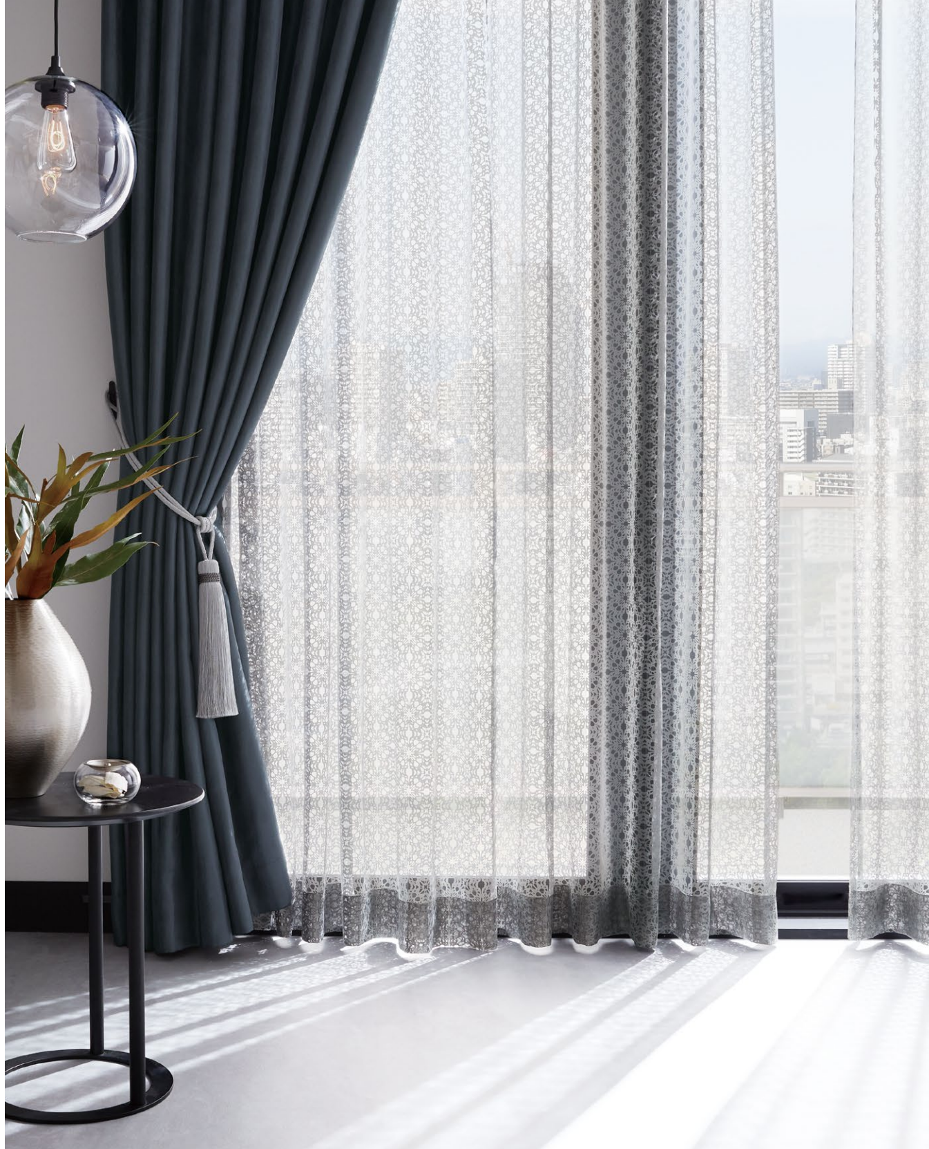
シアーカーテン：SC8596 カーテン(形態安定加工)：SC8479(P.208) タッセル：FN712