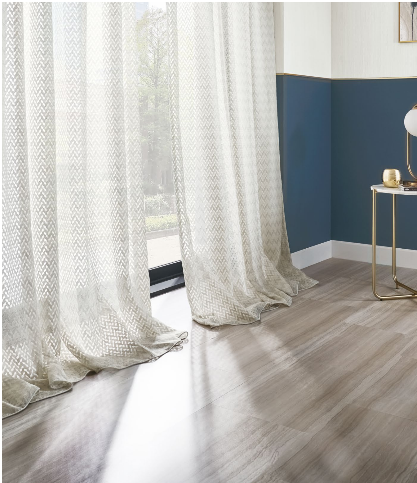
シアーカーテン：SC8593 ウェイトウーリーロック 壁紙：FE74925(2021-2023 FINE)・TH30337(2020-2022 FAITH)