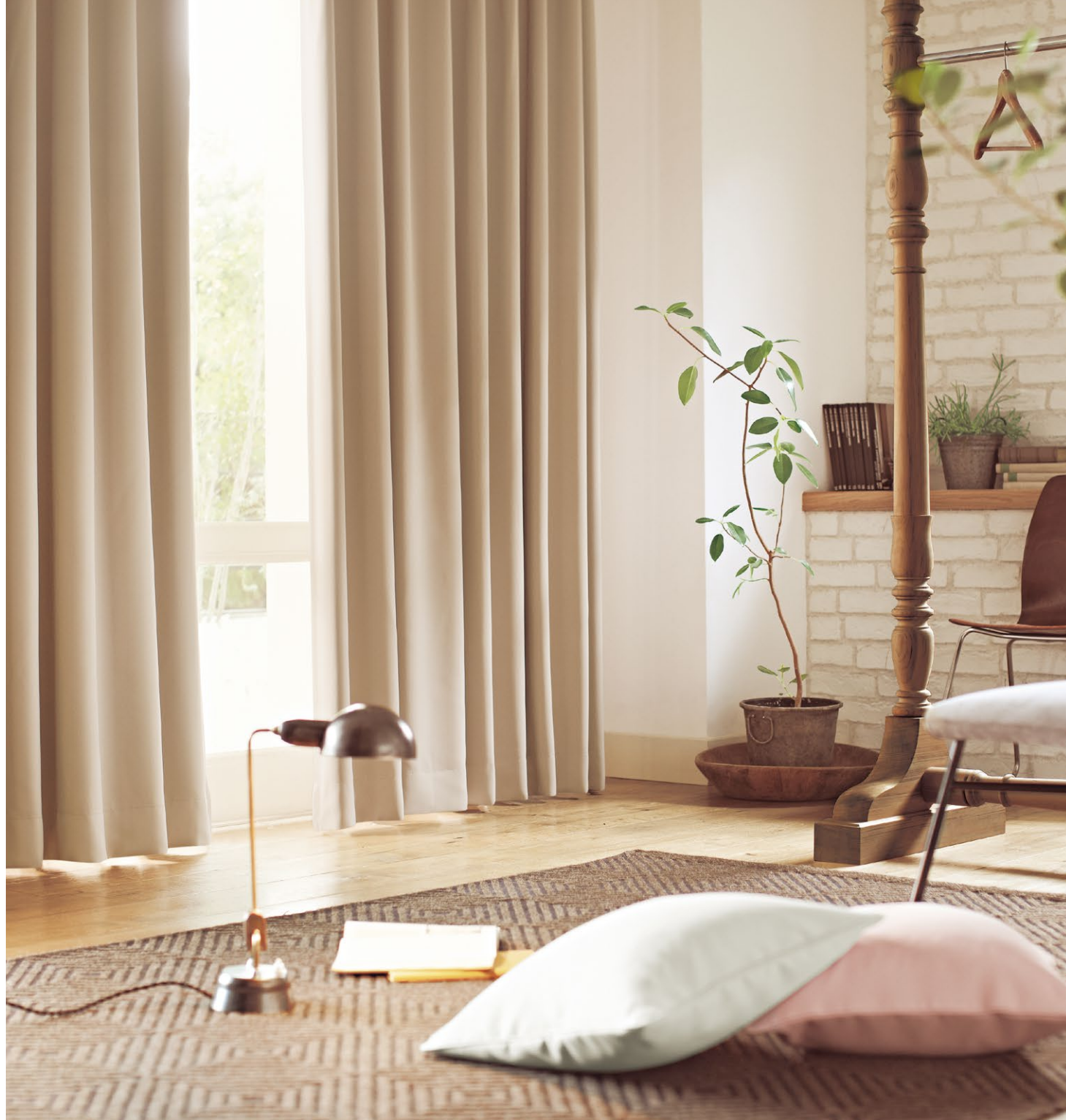
カーテン(形態安定加工) : SC8535 クッション : SC8540, SC8538 壁紙 : RE51294(2020-2022 RéSERVE)