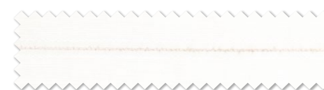
おすすめレース: SC8661 (P.270)