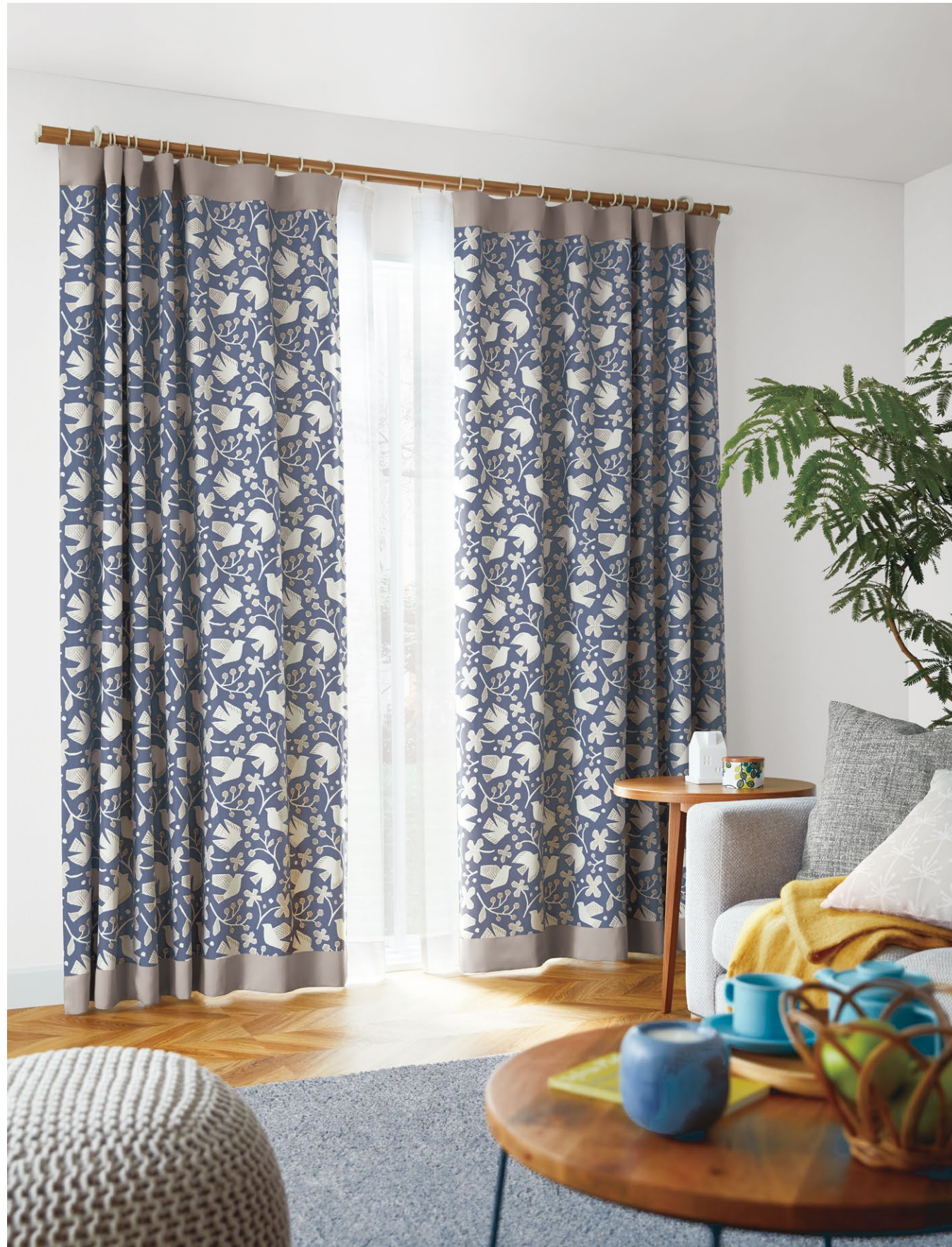
ボーダー付フラットカーテン(トップ&ボトム型、1.5倍) : SC8448・SC8541 (P.220、別冊Beside P.33) フラットシアーカーテン(1.5倍) : SC8661 (P.270) クッション : SC8309 (P.164)、SC8270 (P.148)