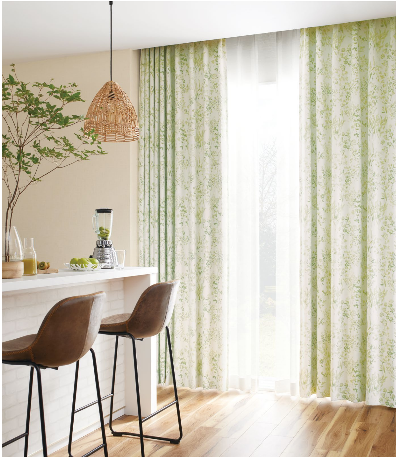
カーテン(形態安定加工) : SC8445 シアーカーテン : SC8684 (P.276) 壁紙 : RE51128, RE51294 (2020-2022 RéSERVE)