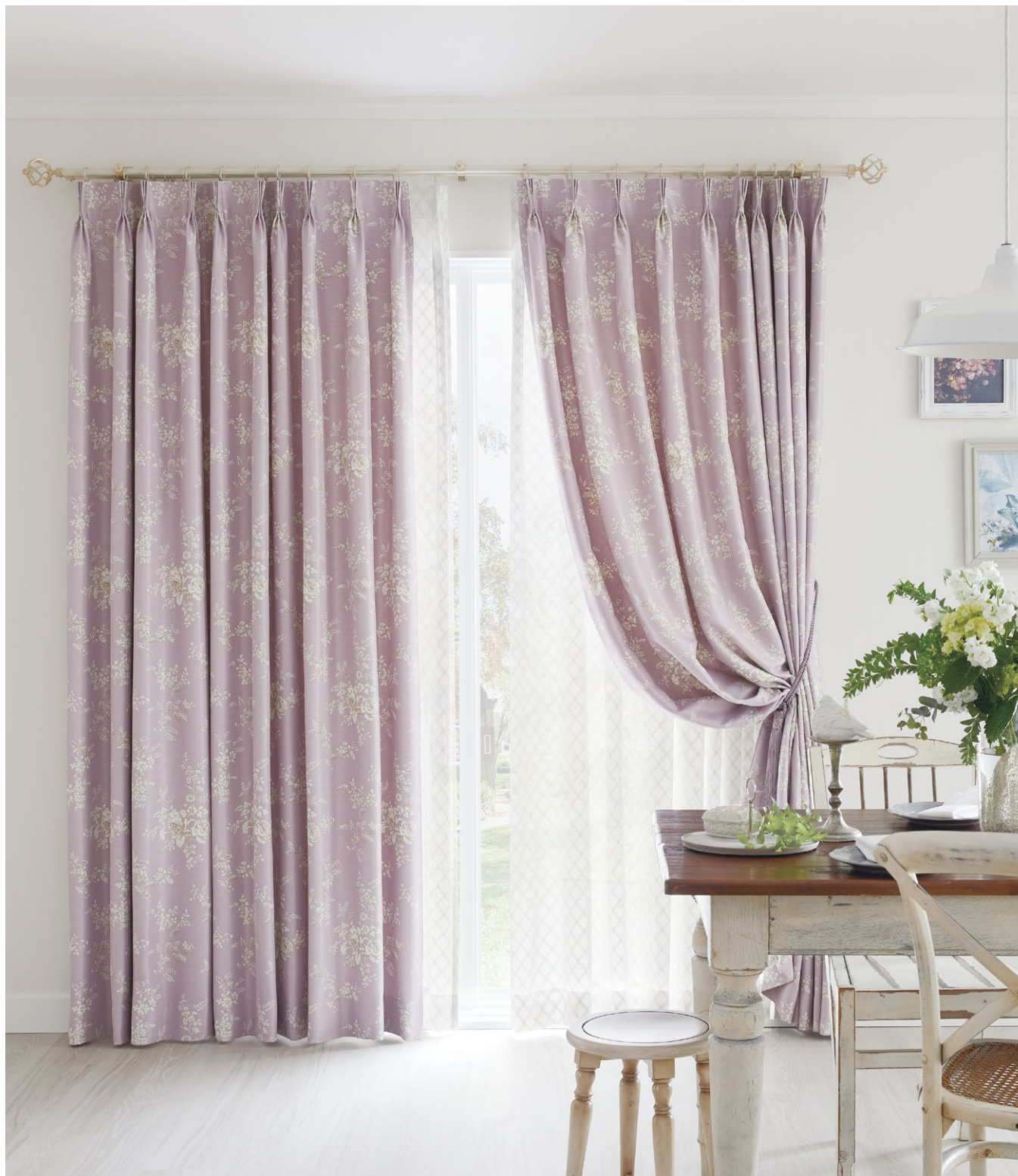
カーテン(形態安定加工) : SC8444 レース : SC8720(P.295) タッセル : FN745