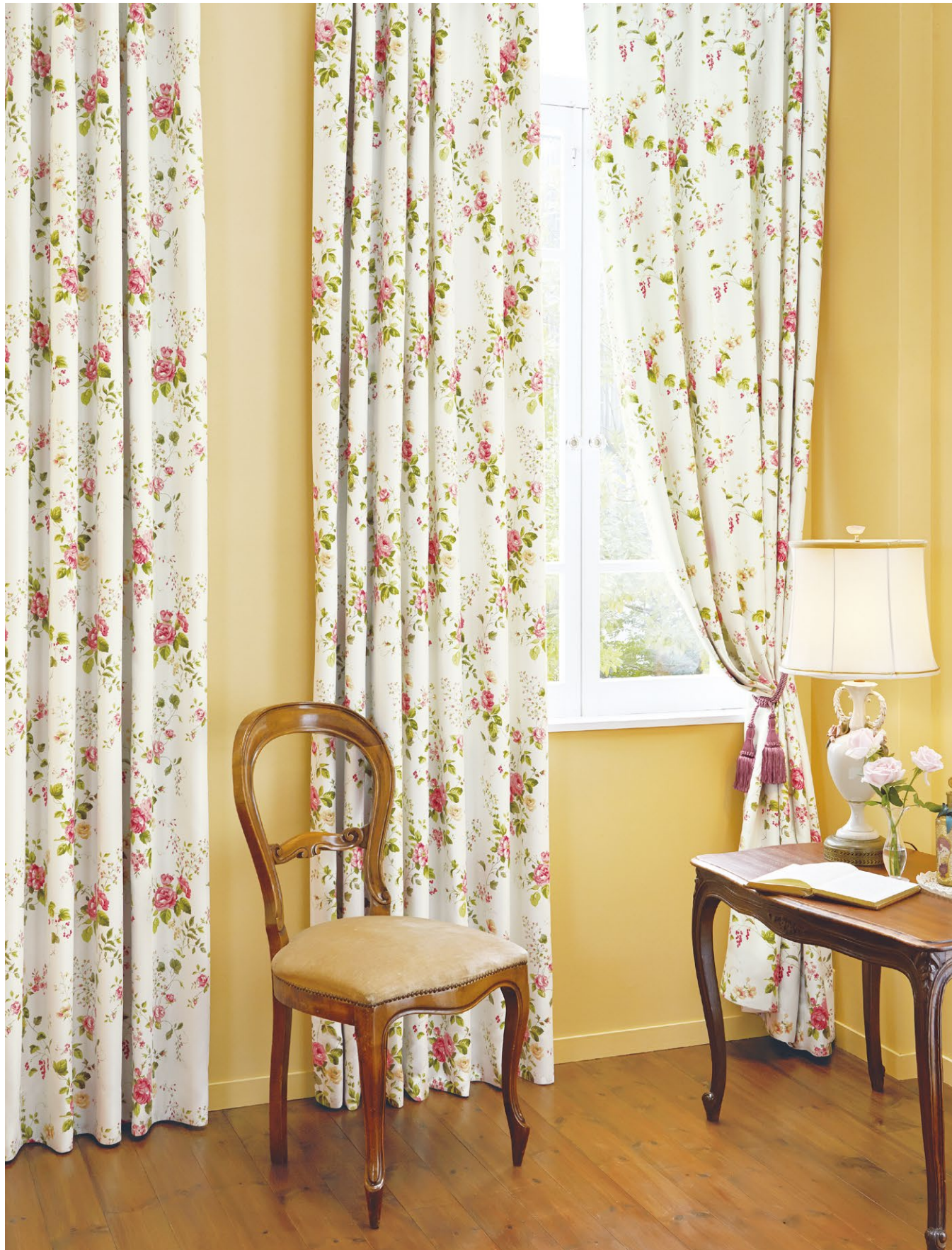
カーテン(形態安定加工) : SC8442 タッセル : FN464 壁紙 : SGA2404(2021-2024 XSELECT)