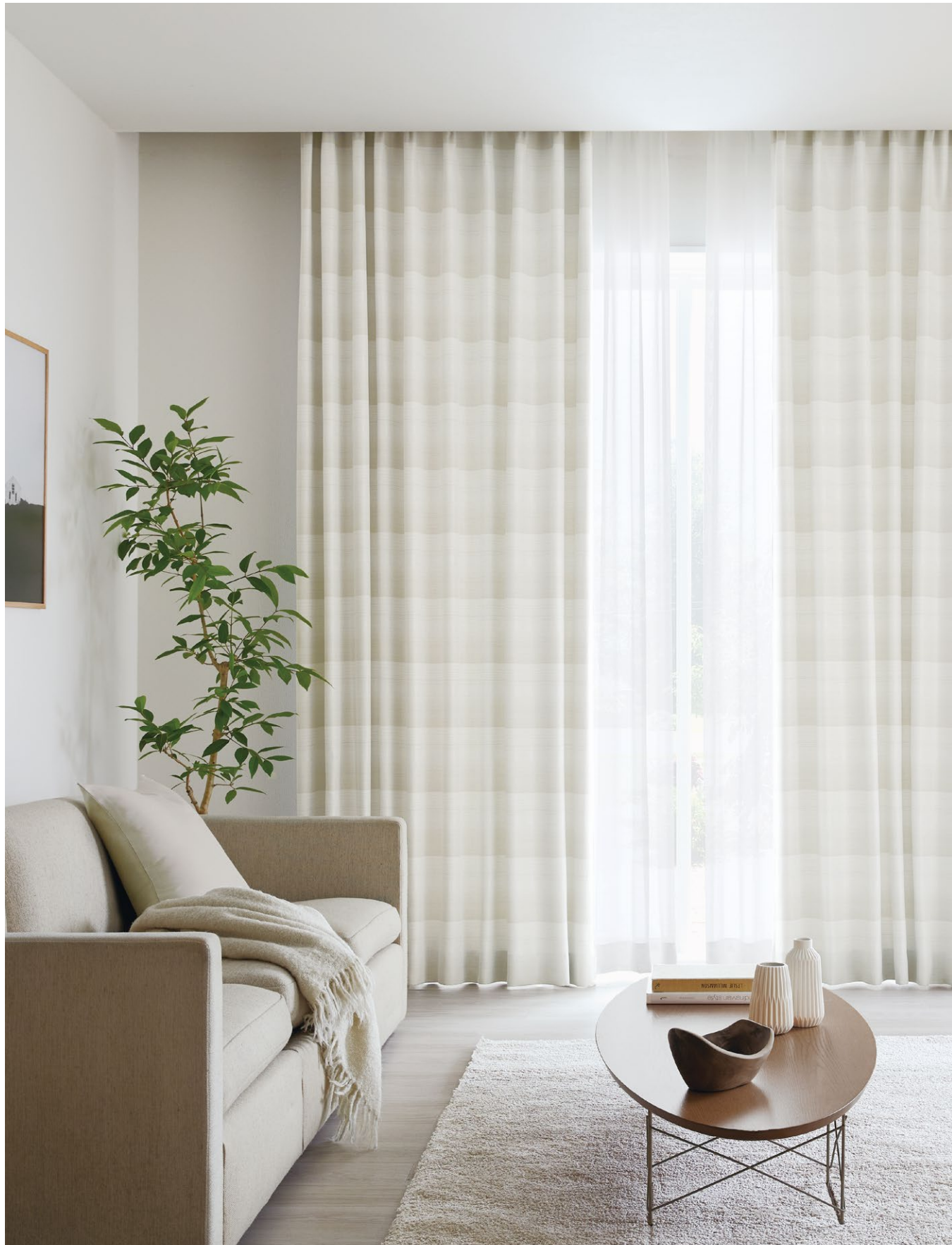
カーテン：SC8438 シアーカーテン：SC8235(P.124) クッション：SC8512(P.218)