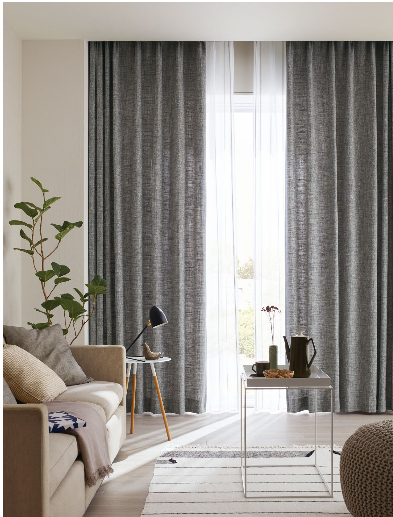
カーテン(形態安定加工): SC8309 シアーカーテン: SC8656 ウェイトウーリーロック(P.267) クッション: SC8226(P.120) 壁紙: SGB2121(2021-2024 XSELECT)