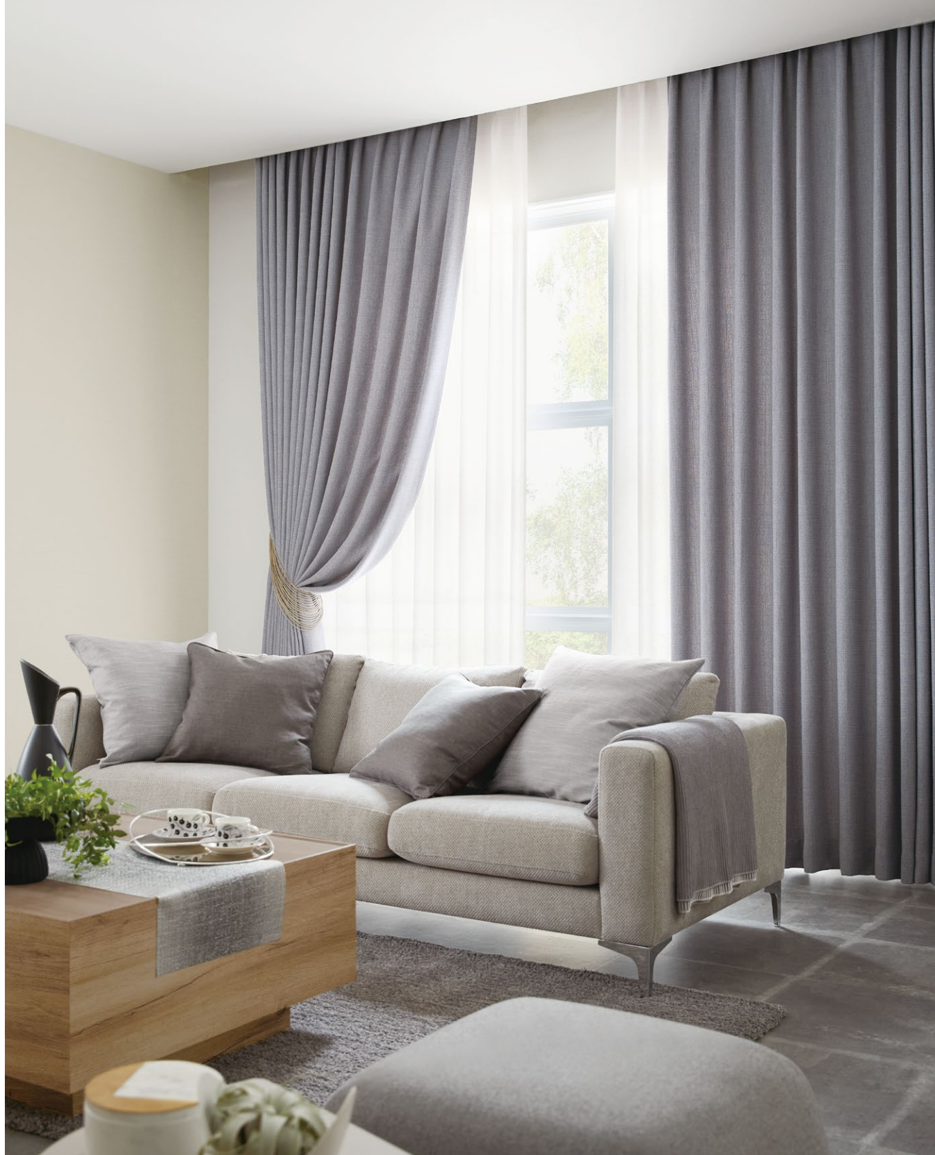
カーテン(形態安定加工)：SC8305 シアーカーテン：SC8684(P.276) タッセル：FN721 クッション：SC8224(P.120)、SC8212(P.113) 壁紙：RE51773(2020-2022 ReSERVE)