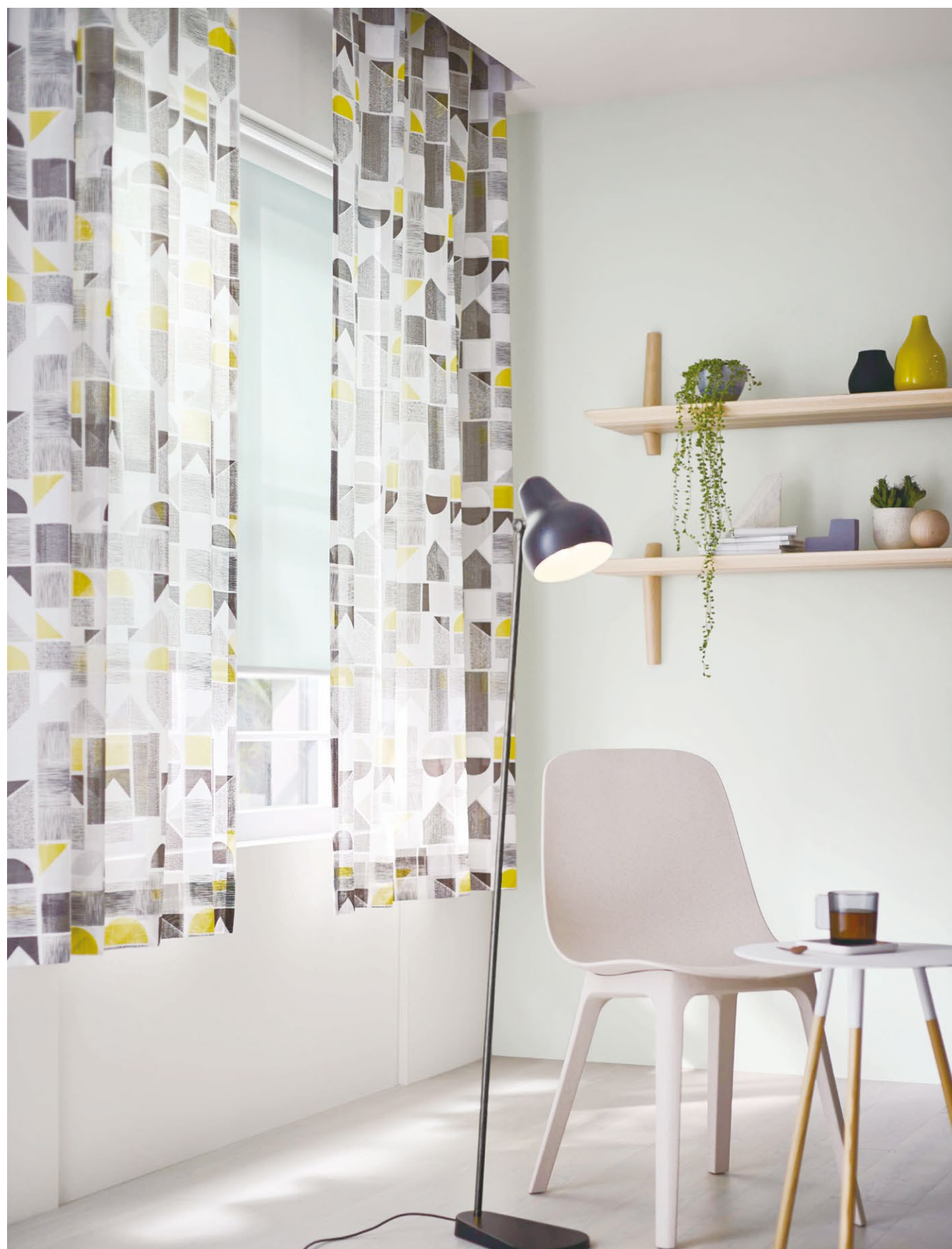
フラットシアーカーテン(1.5倍): SC8288 ロールスクリーン: SC8385(P.175) 壁紙: SGB2271(2021-2024 XSELECT)