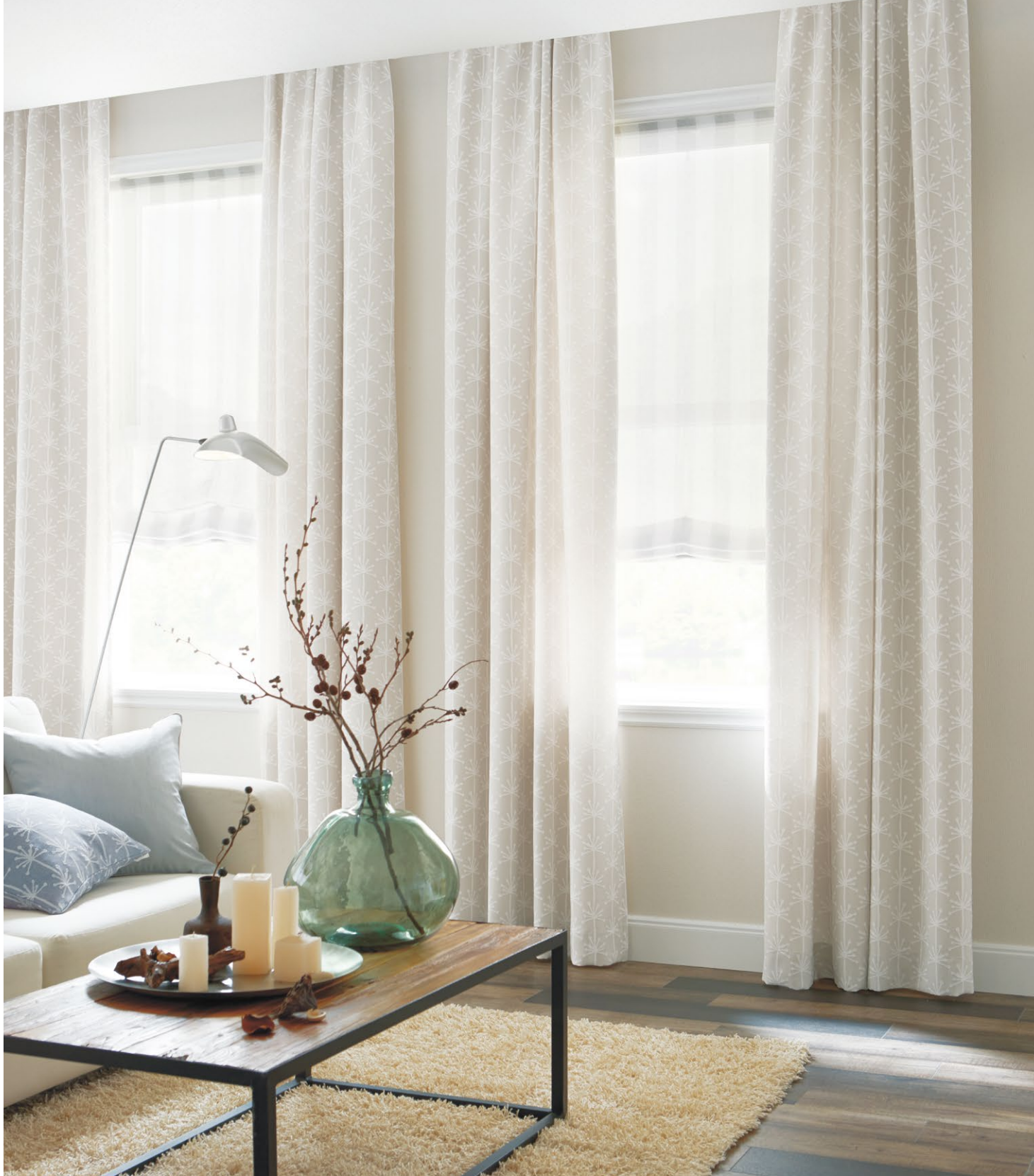
カーテン：SC8270 プレーンシェード：SC8653(P.266) クッション：SC8272, SC8340(P.171)