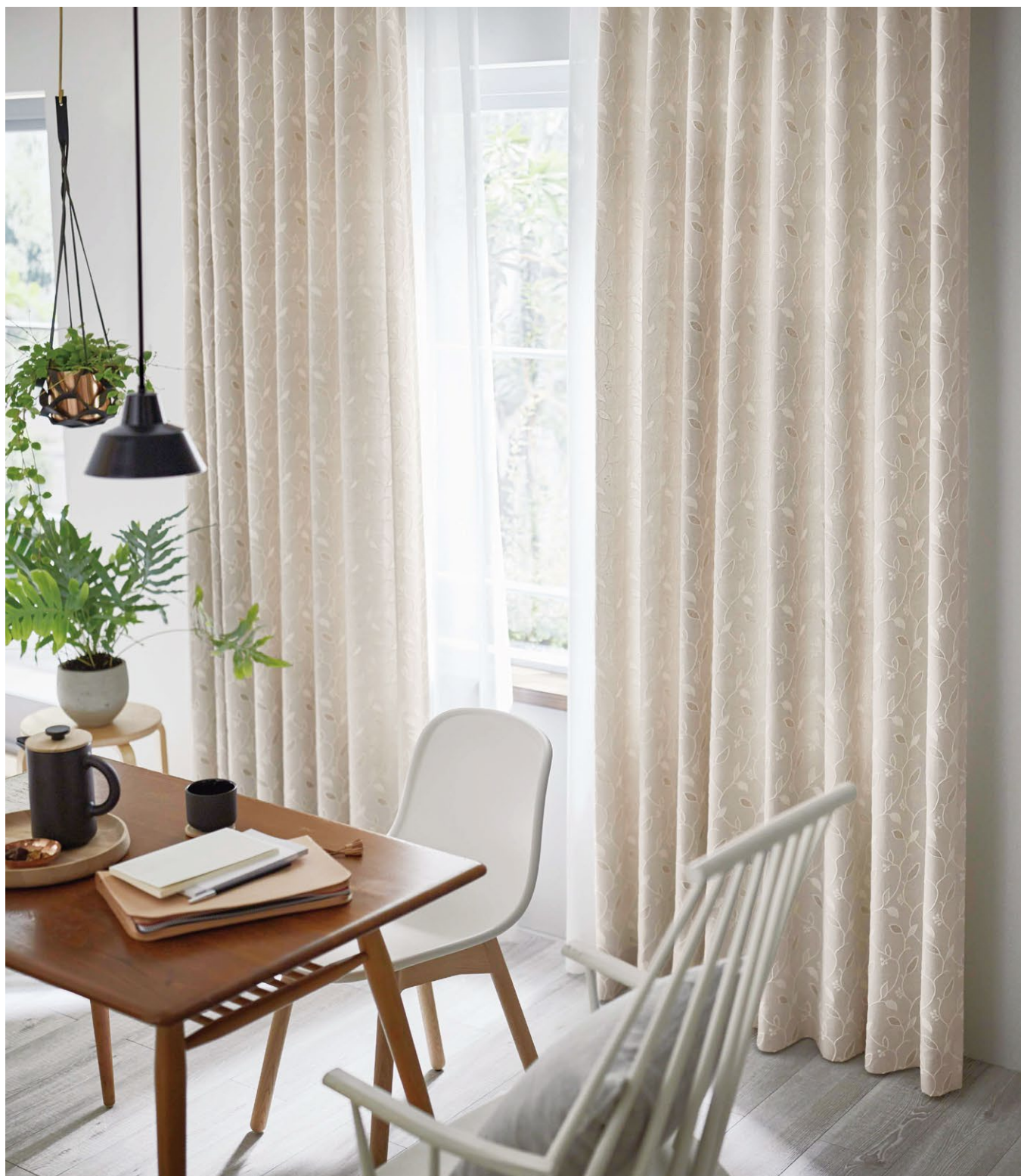
カーテン(形態安定加工) : SC8252 レース : SC8706(P.288)