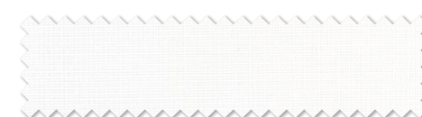
おすすめレース : SC8706 (P.288)