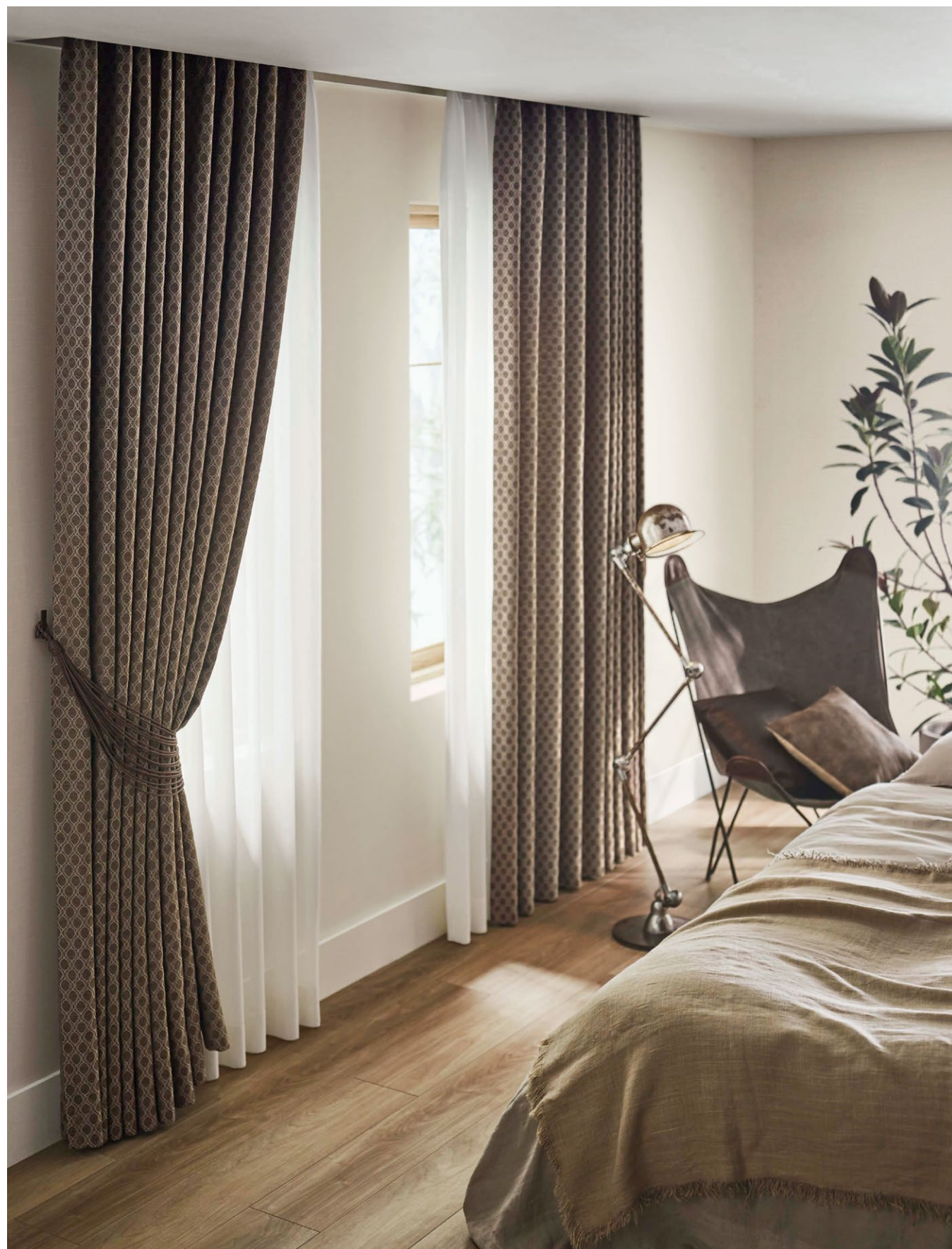
カーテン(形態安定加工) : SC8243 レース : SC8699(P.283) タッセル : FN723 壁紙 : RE51129(2022-2022 RéSERVE)