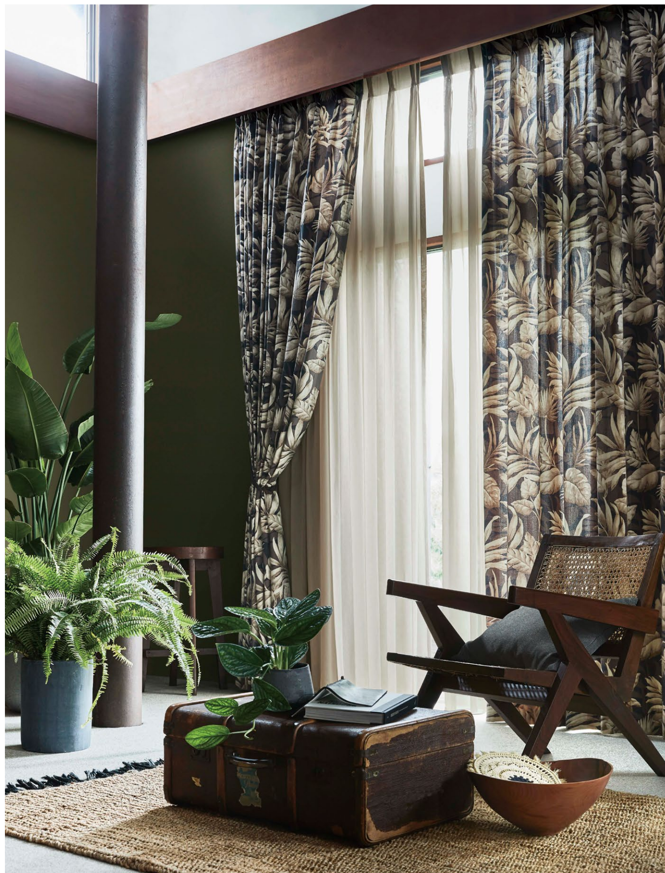
カーテン(形態安定加工) : SC8240 シアーカーテン : SC8633 ウェイトウーリーロック(P.257) タッセル : FN749 クッション : SC8245(P.132) 壁紙 : FE74014(2021-2023 FINE)