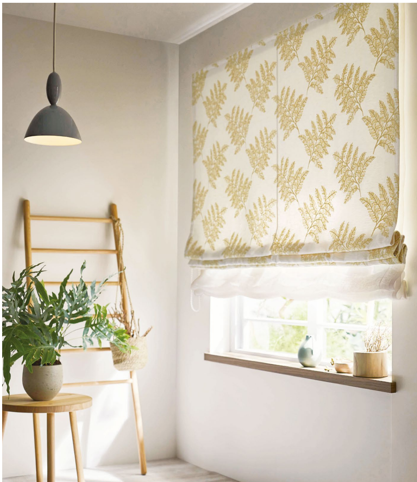
ツインシェード(プレーン+プレーン)：(前幕)SC8238 (後幕)SC8221 (P.118) 壁紙：FE74273(2021-2023 FINE)