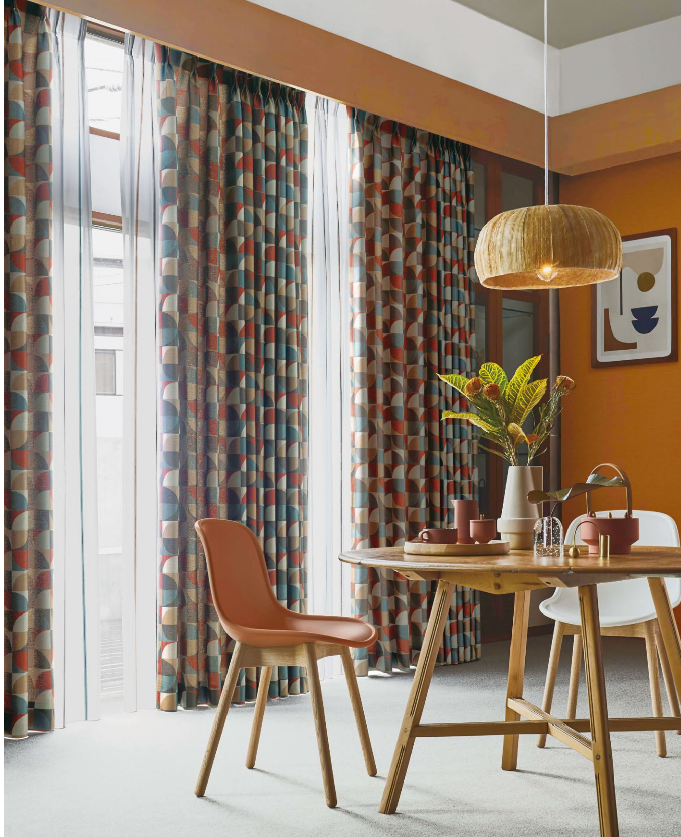
カーテン(形態安定加工)：SC8237 シアーカーテン：SC8655 ウェイトウーリーロック(P.267) 壁紙：TH30175(2020-2022 FAITH)