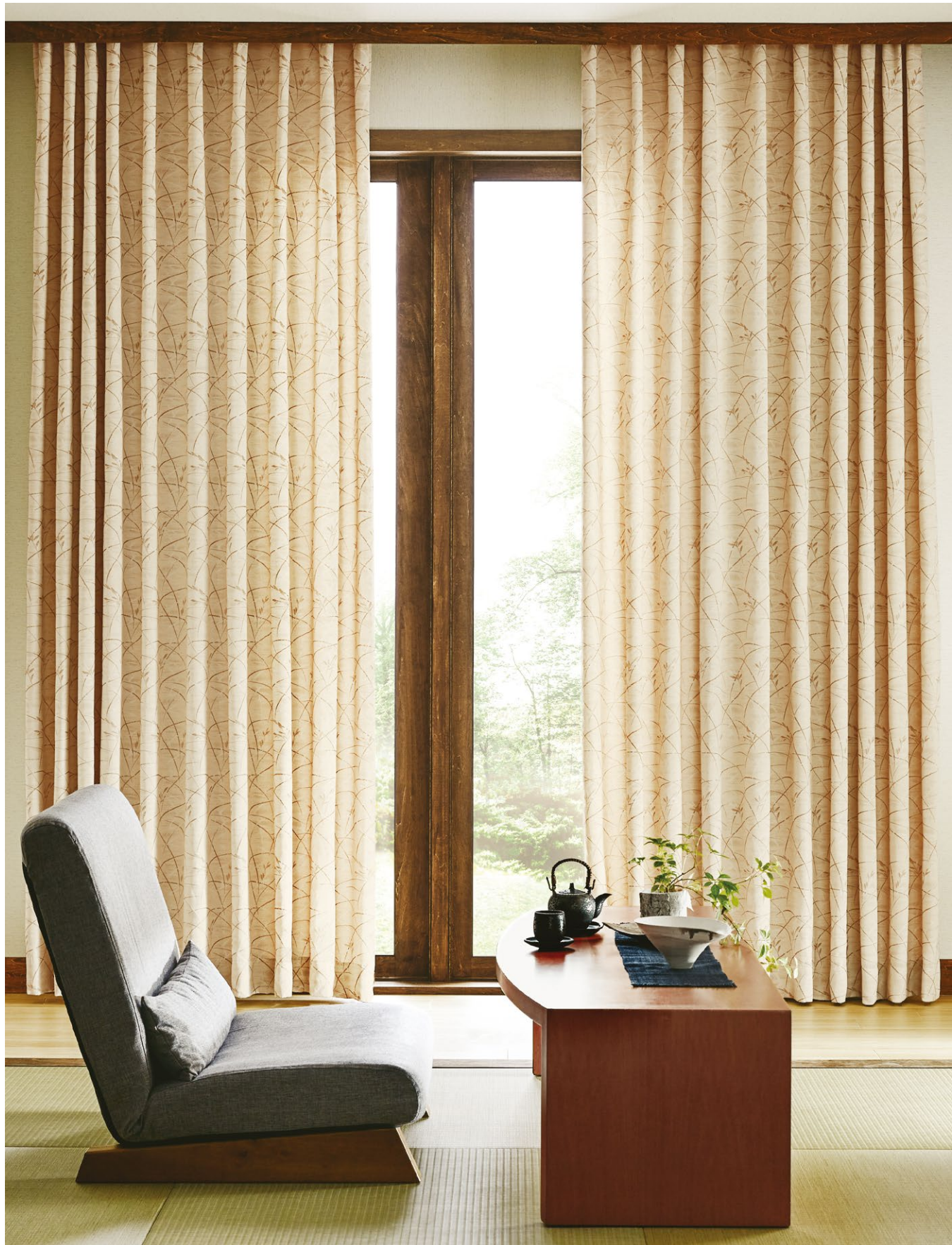
カーテン(形態安定加工) : SC8206