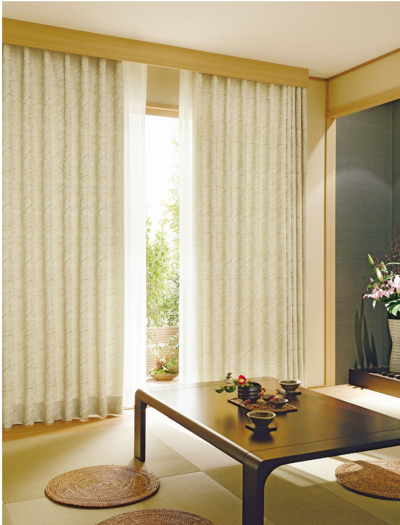
カーテン(形態安定加工) : SC8203 シアーカーテン : SC8688(P.278) 壁紙 : TH30507(2020-2022 FAITH)