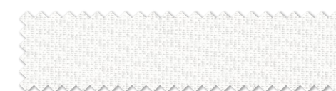
おすすめレース: SC8751 (P.308)