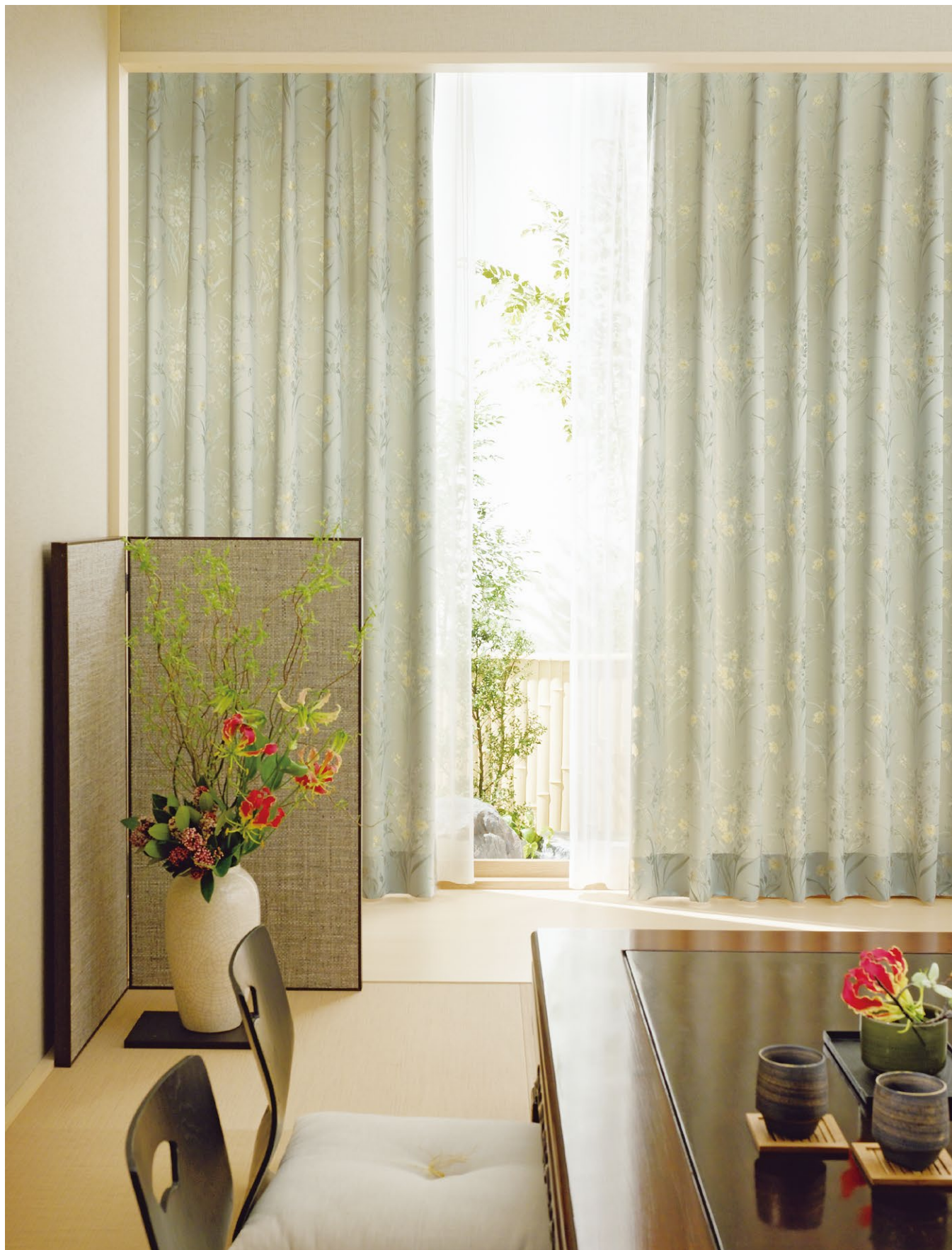
カーテン(形態安定加工): SC8202 レース: SC8751 (P.308)