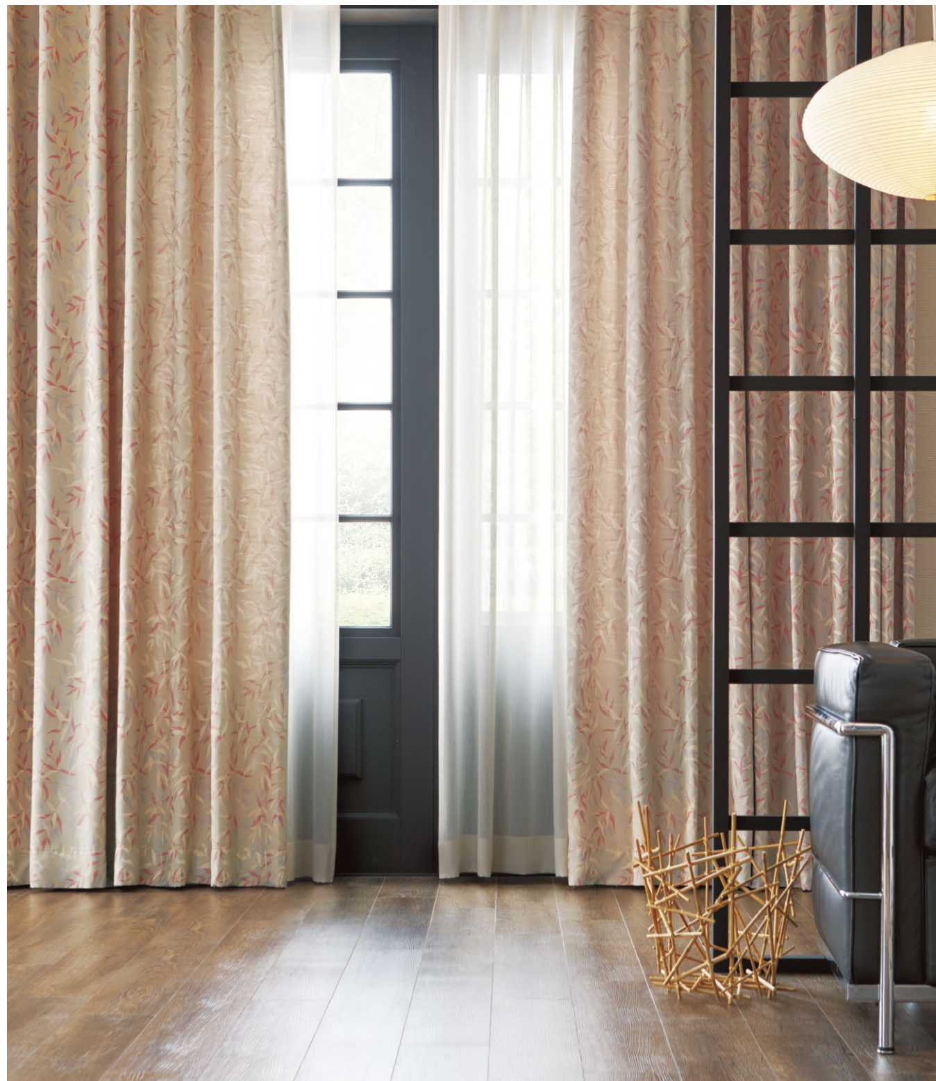
カーテン(形態安定加工) : SC8198 シアーカーテン : SC8688(P.278)