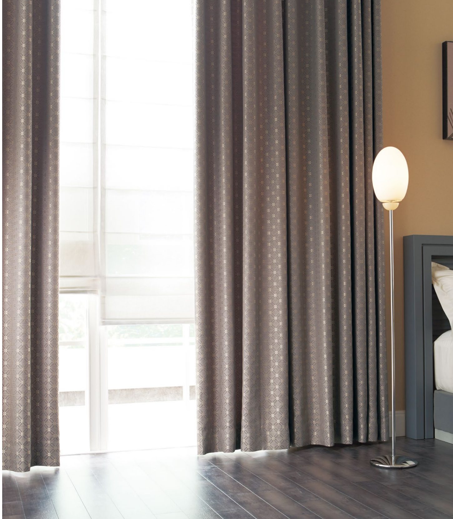
カーテン(形態安定加工) : SC8195 シャープシェード : SC8666 (P.272)