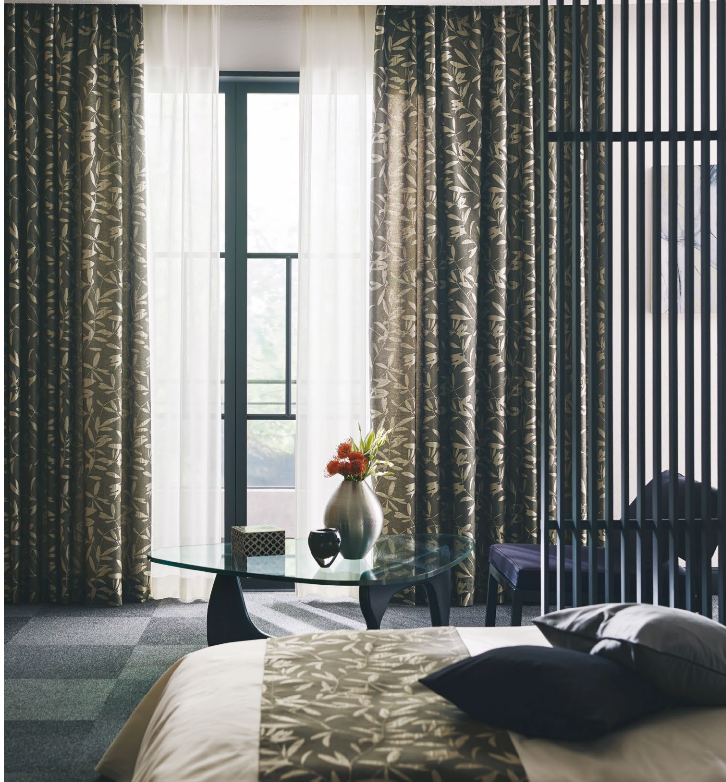
カーテン(形態安定加工) : SC8184 シアーカーテン : SC8688(P.278) クッション : SC8413(P.178)、SC8360(P.173) フットスロー : SC8184