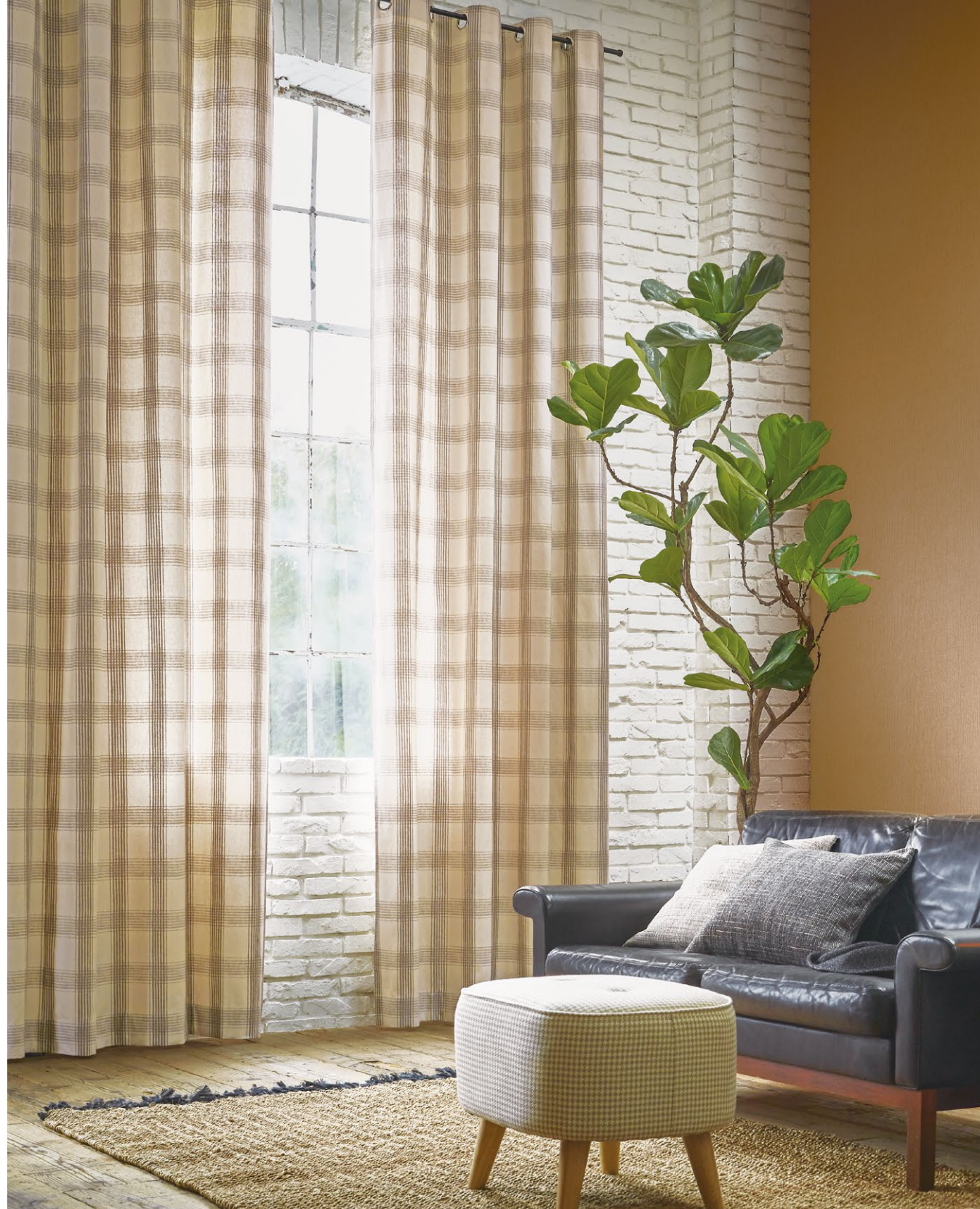
ハトメカーテン(1.5倍) : SC8172 クッション : SC8175、SC8178(P.94) 壁紙 : BW4685(2021 EDA)