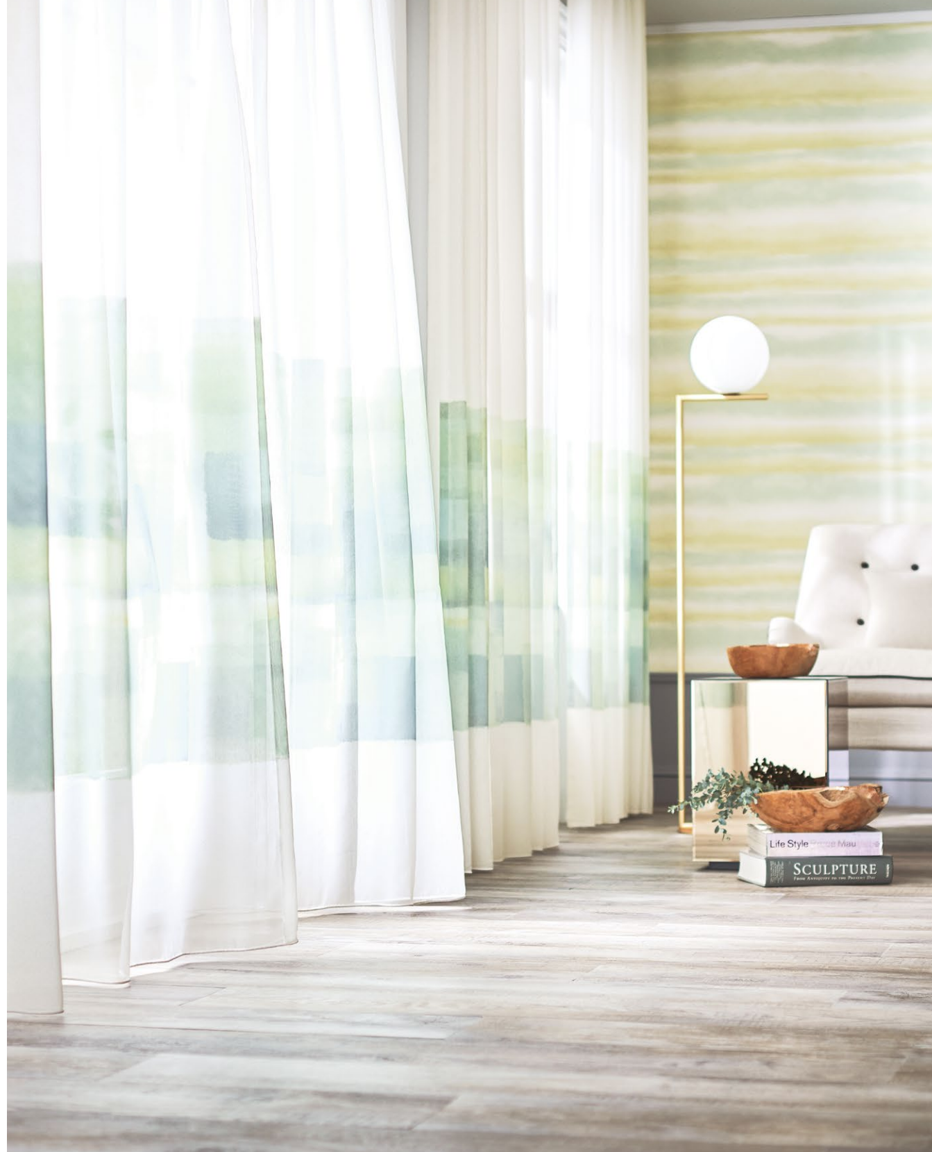
シアーカーテン：SC8171 ウェイトウーリーロック 壁紙：BW4692(2021 EDA)

標準価格 3,840 円/m 2 [11,500円/m] 有効巾 300 cm (ヨコ使い)