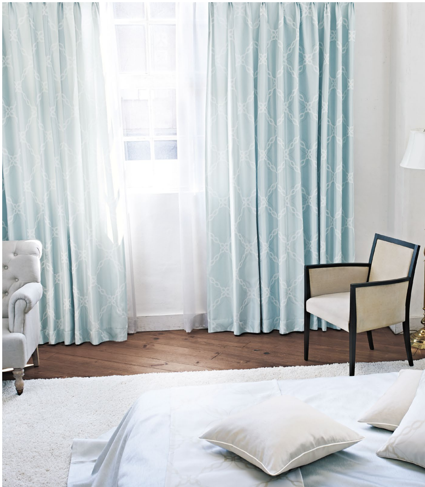
カーテン(形態安定加工) : SC8136 シアーカーテン : SC8644(P.262) クッション : SC8348(P.173)