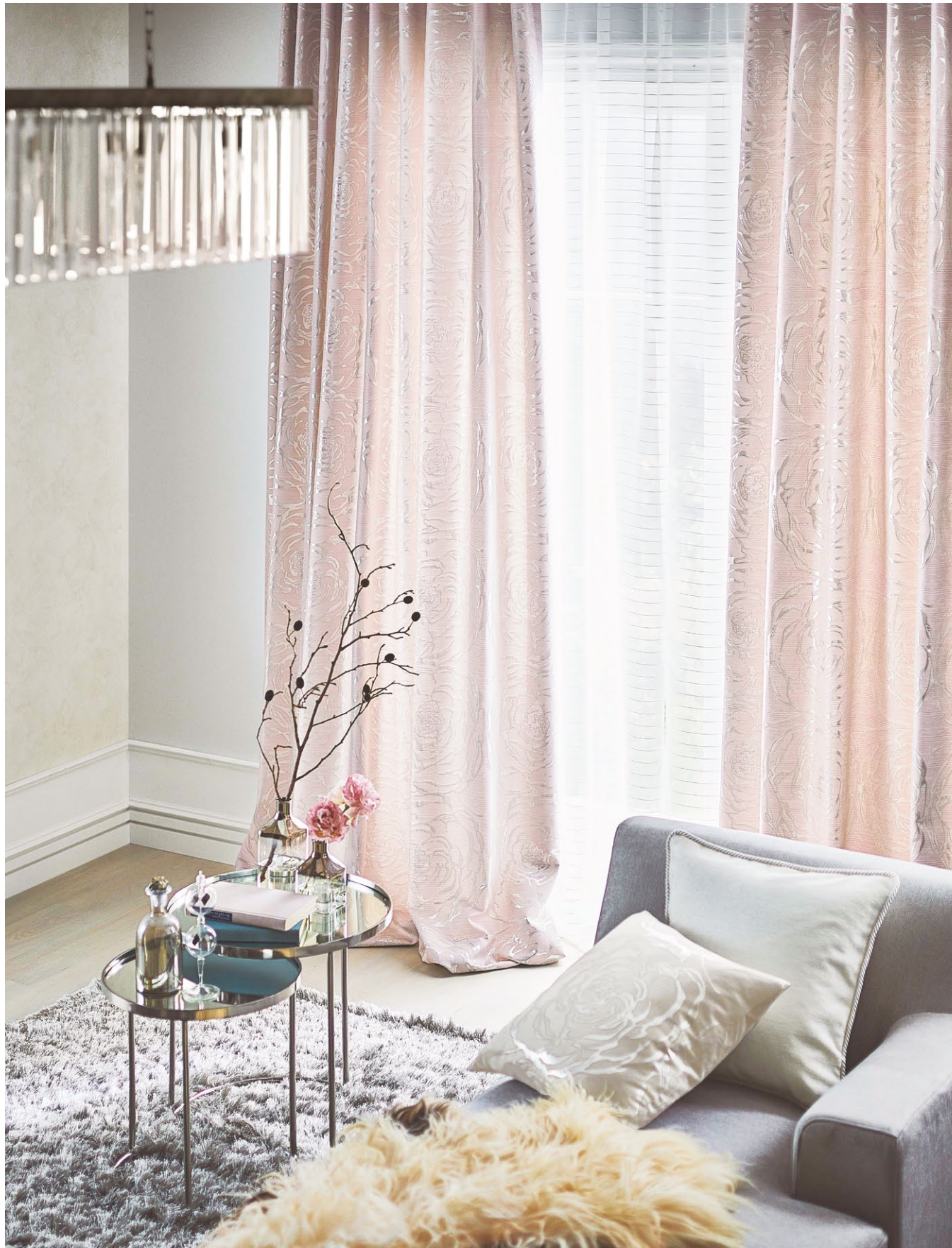
カーテン：SC8123 シアーカーテン：SC8660(P.269) クッション：SC8122 パイピングクッション：SC8291(P.161)・FN811 壁紙：TH30862(2020-2022 FAITH)