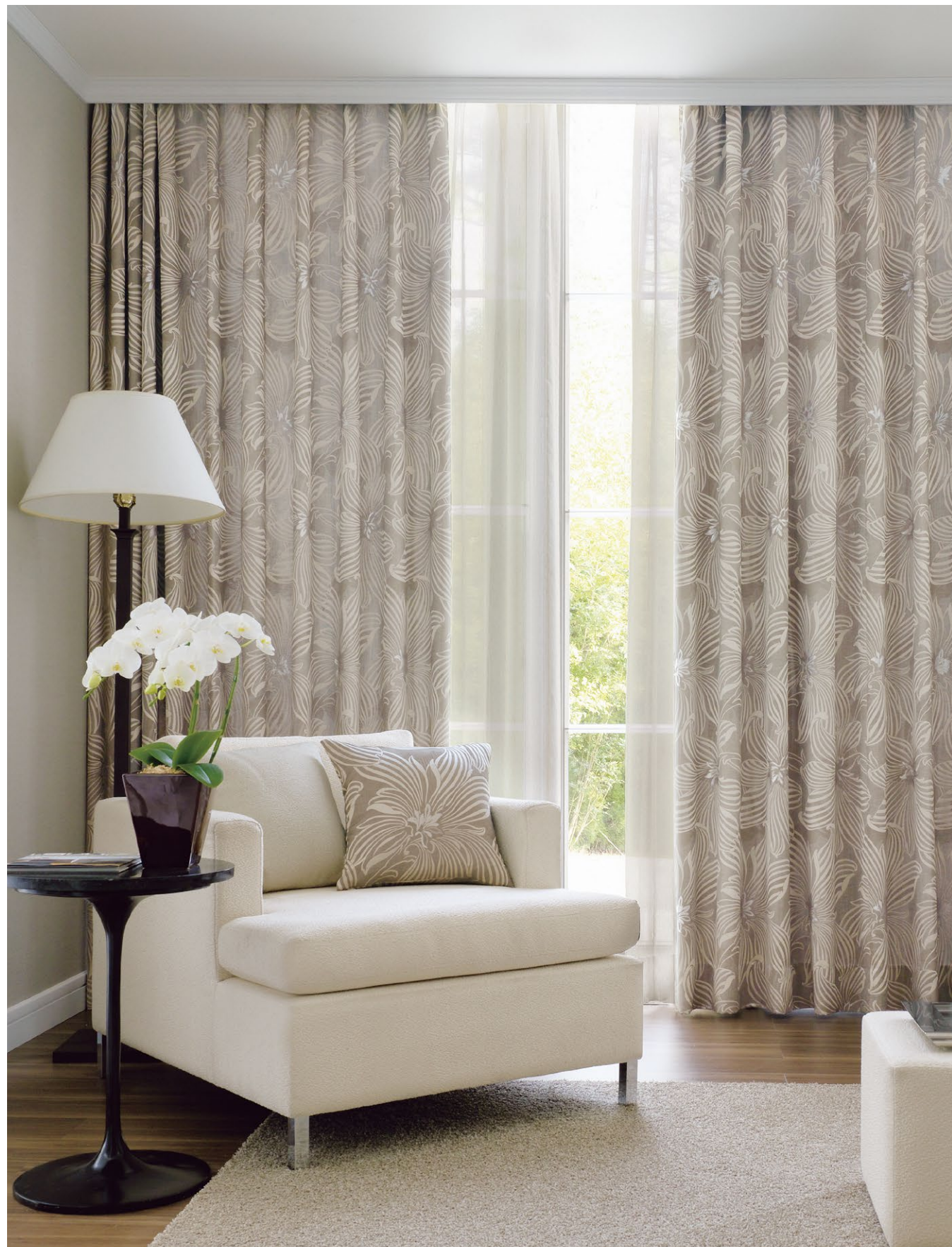
カーテン(形態安定加工): SC8121 シアーカーテン: SC8677(P.274) クッション: SC8347(P.173), SC8121