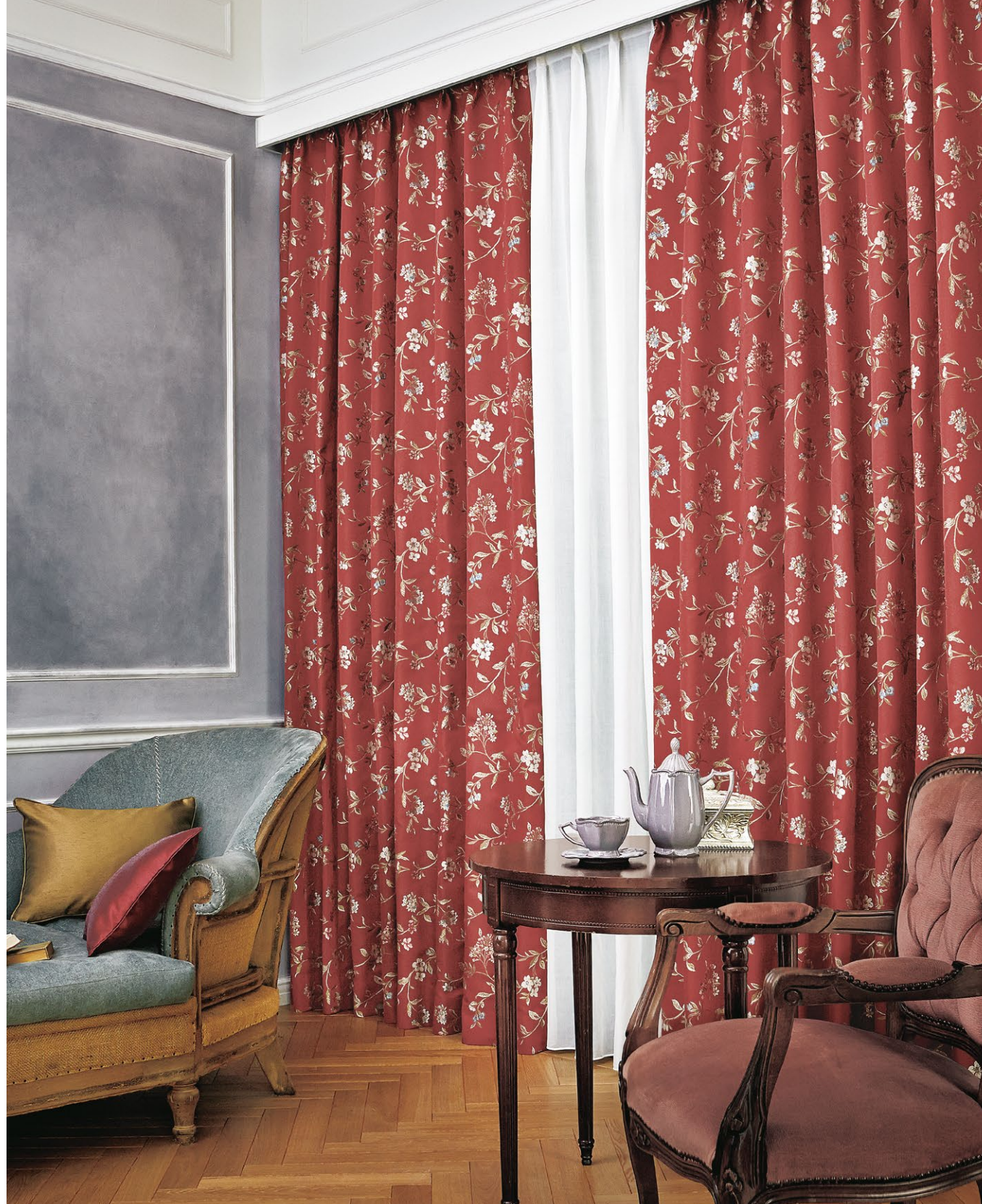
カーテン(形態安定加工) : SC8117 シアーカーテン : SC8687 ウェイトウーリーロック (P.277) クッション : SC8354, SC8363 (P.173)