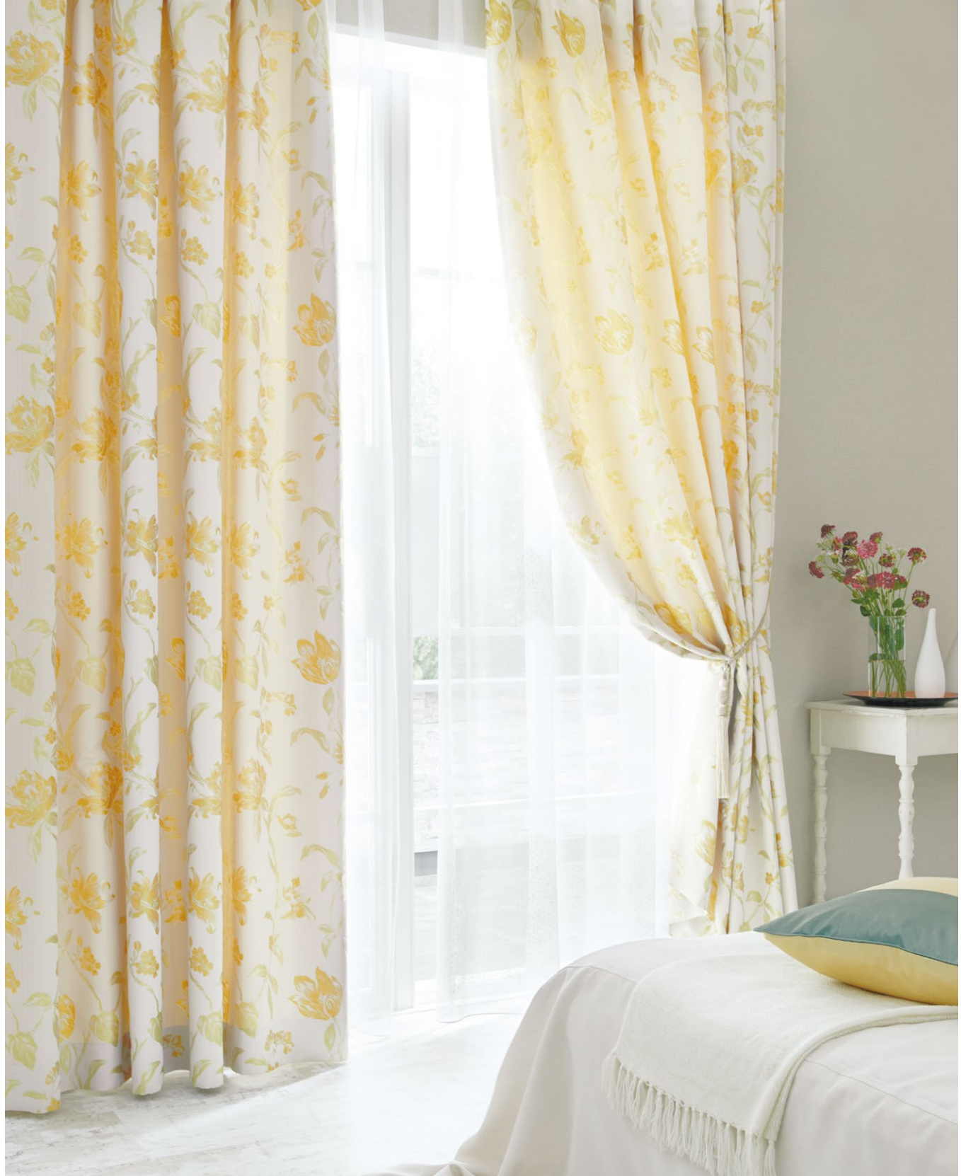
カーテン：SC8116 シアーカーテン：SC8608 ウェイトウーリーロック (P.244) タッセル：FN731 パッチワーククッション：SC8381・SC8384 (P.175)