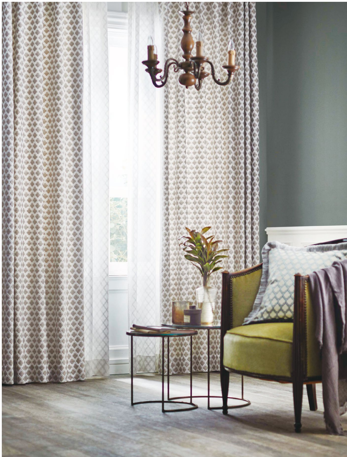
カーテン(形態安定加工) : SC8102 レース : SC8720(P.295) トリム付クッション : SC8103・FN708 壁紙 : SGA2408(2021-2024 XSELECT)