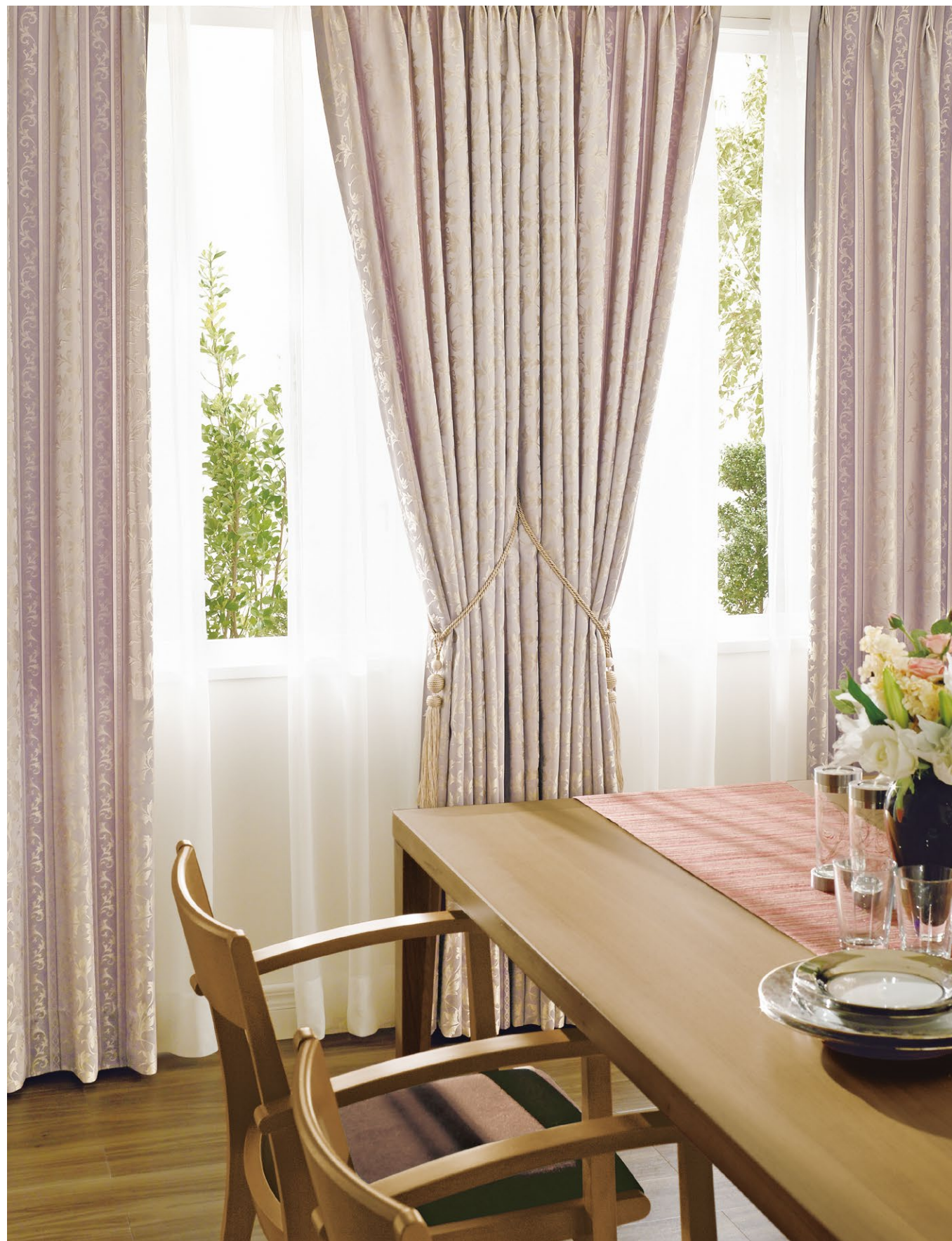
カーテン(形態安定加工、ヒダ柄取り縫製) : SC8101 シアーカーテン : SC8689(P.278) タッセル : FN731