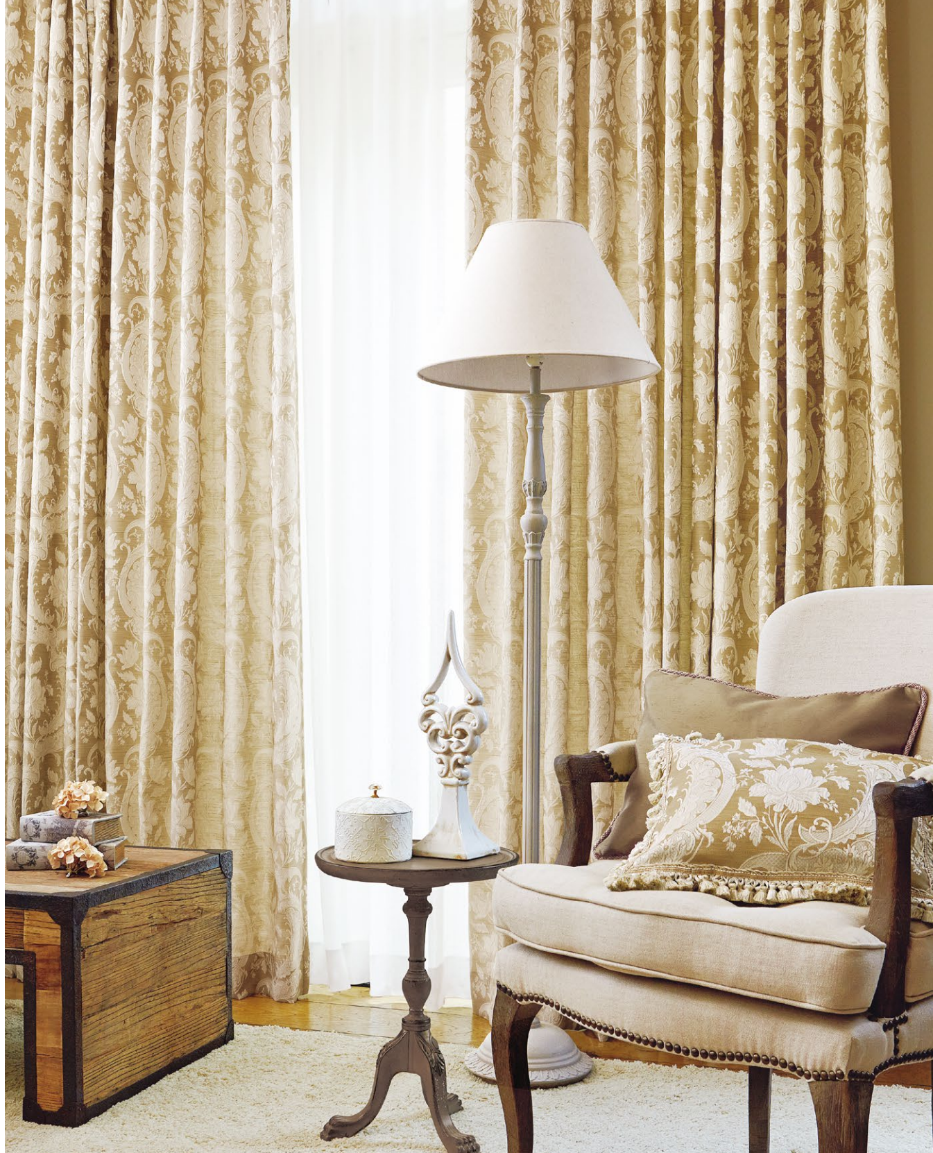
カーテン(形状記憶加工) : SC8095 シアーカーテン : SC8235 (P.124)