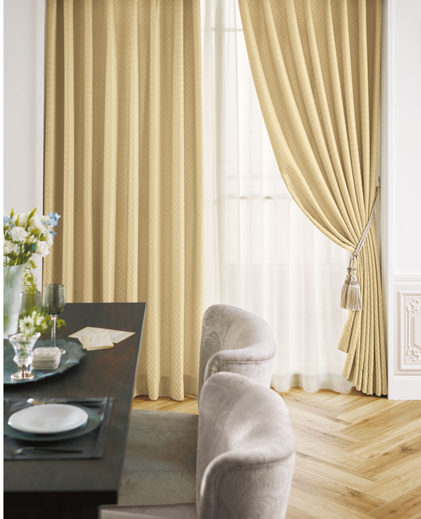
カーテン(形態安定加工) : SC8090 シアーカーテン : SC8645(P.262) タッセル : FN737