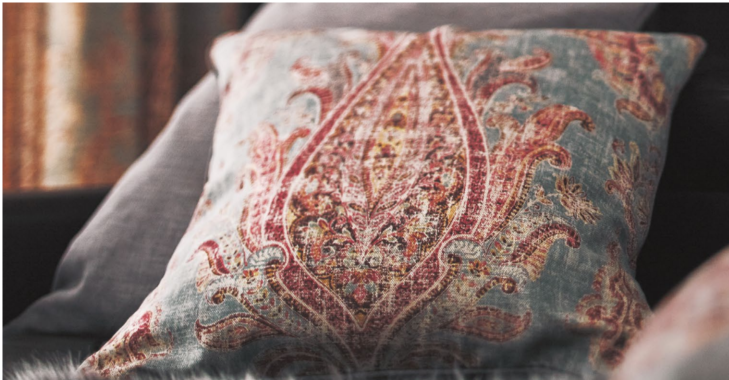
カーテン、クッション：SC8081