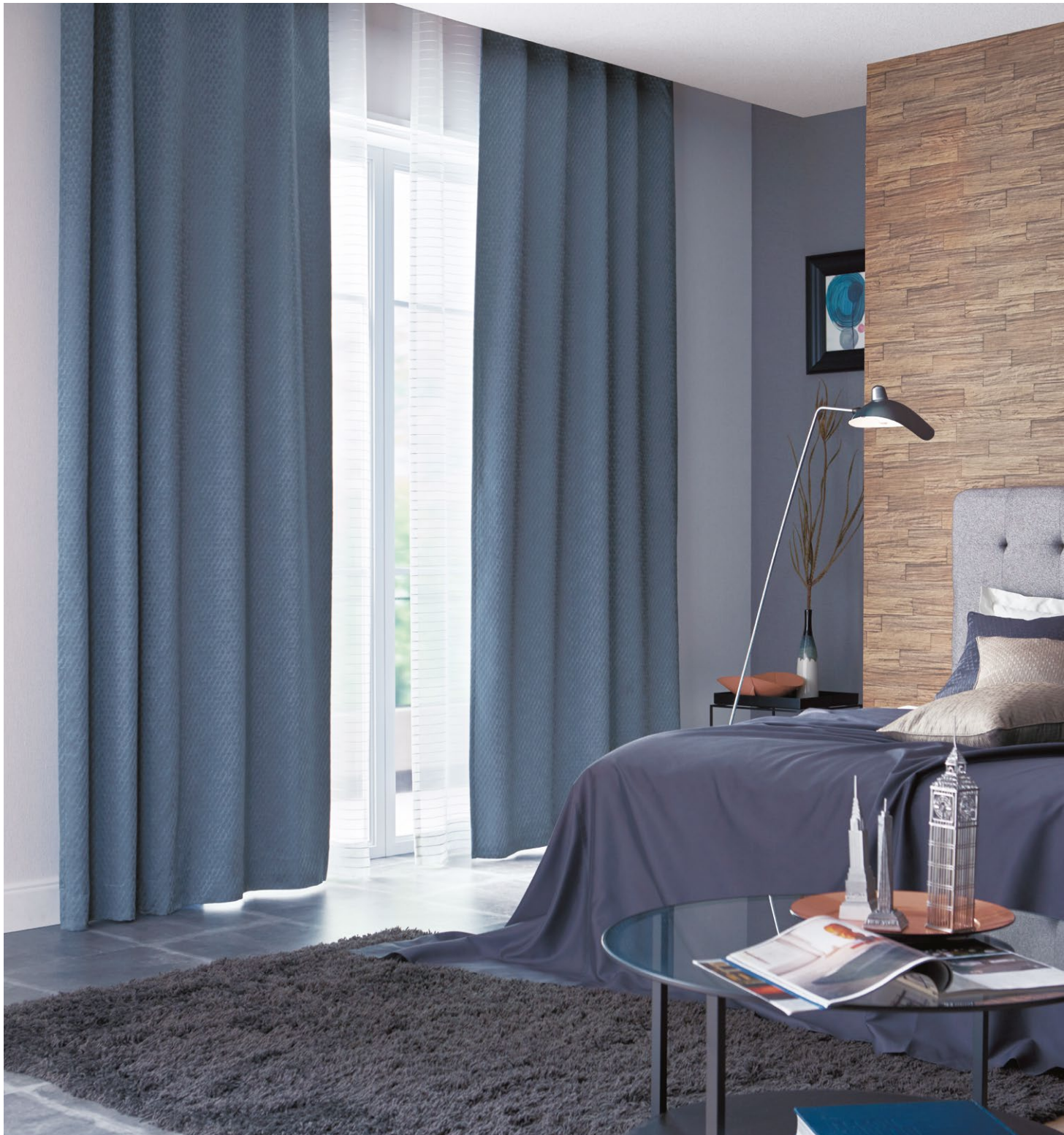
フラットカーテン(1.5倍) : SC8065、SC8660(P.269) クッション : SC8064、SC8065 壁紙 : RE51320(2020-2022 RéSERVE)