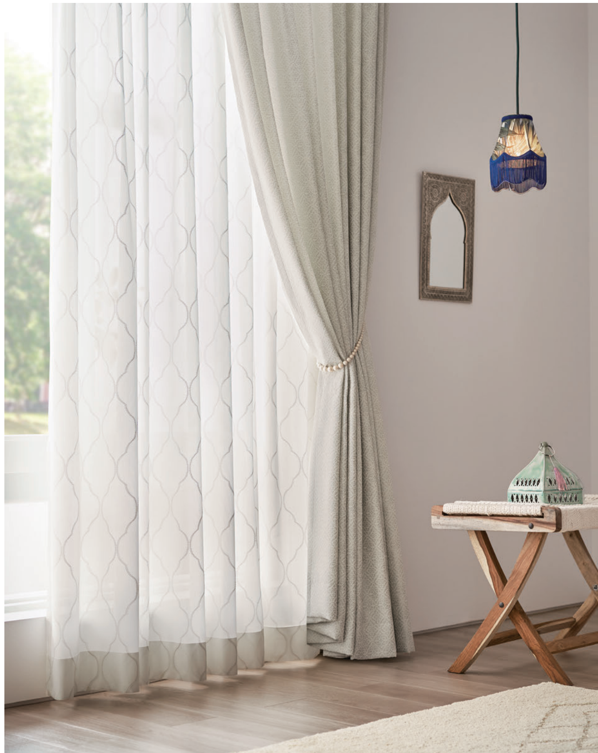
LS-63496 / ドレープ LS-63278 / タッセル 63662T