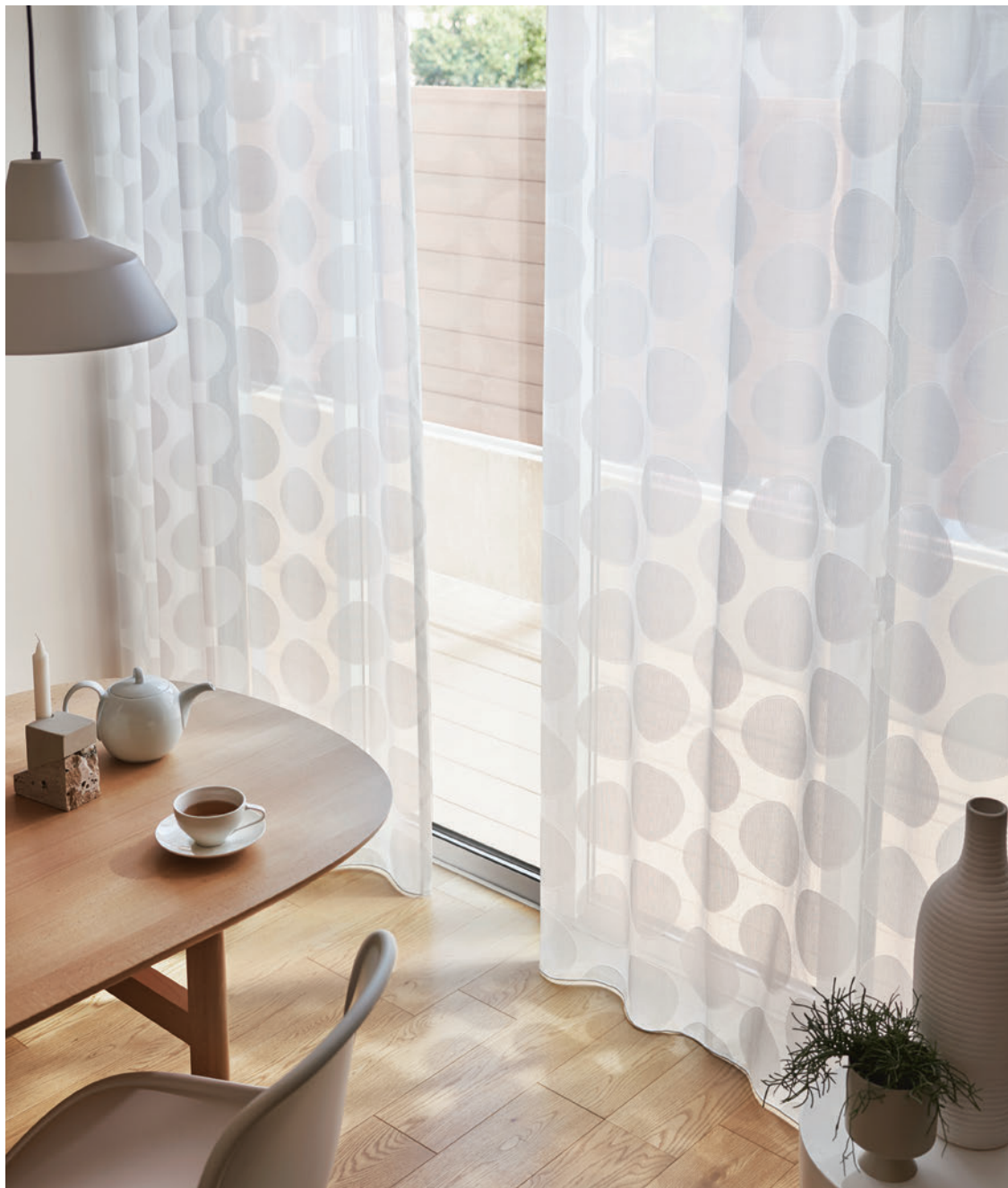
フラットカーテン ウェイトテープ巻きロック加工 LS-63453