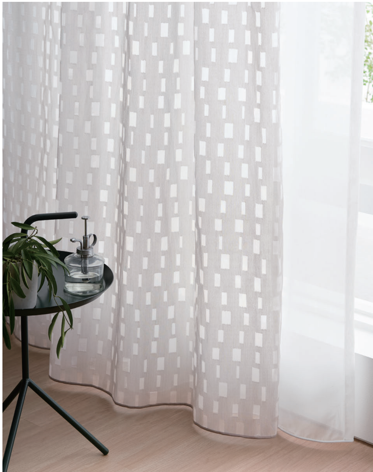
ウエイトテープ巻きロック加工 LS-63451・LS-63521

柄部分の透け感が楽しい、バックカットのジャカード。 ドレープとしても、一枚掛けの中薄地としても。