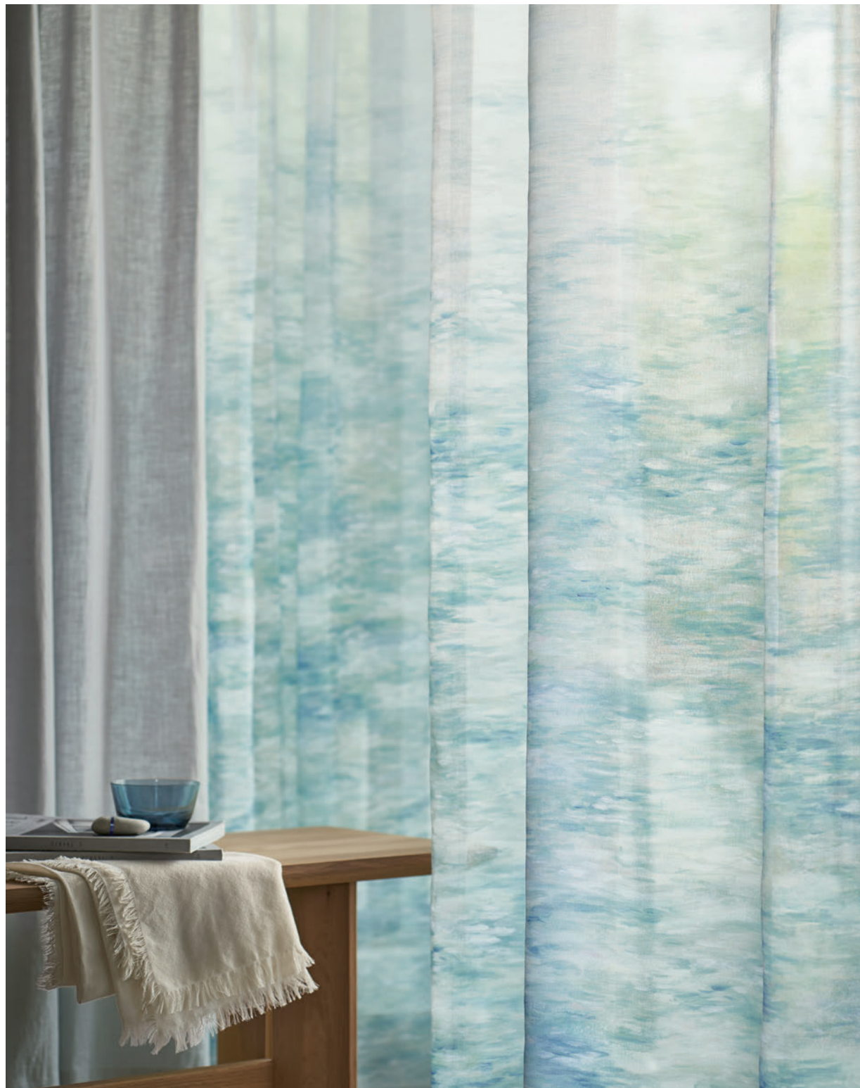
LS-63448 / ドレープ LS-63165

水面を思わせる風景を水彩タッチで抽象的に描いた、透明感のあるプリントポイルです。