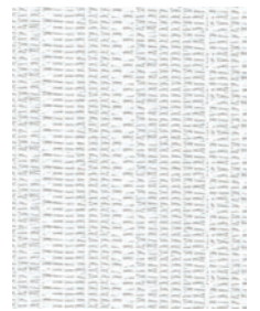
ウォッシュブル / 遮熱 / 超耐光 / ミラー