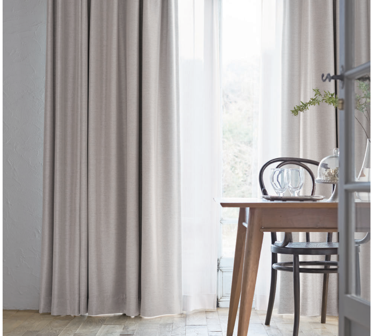
LS-63407 / レース LS-63508